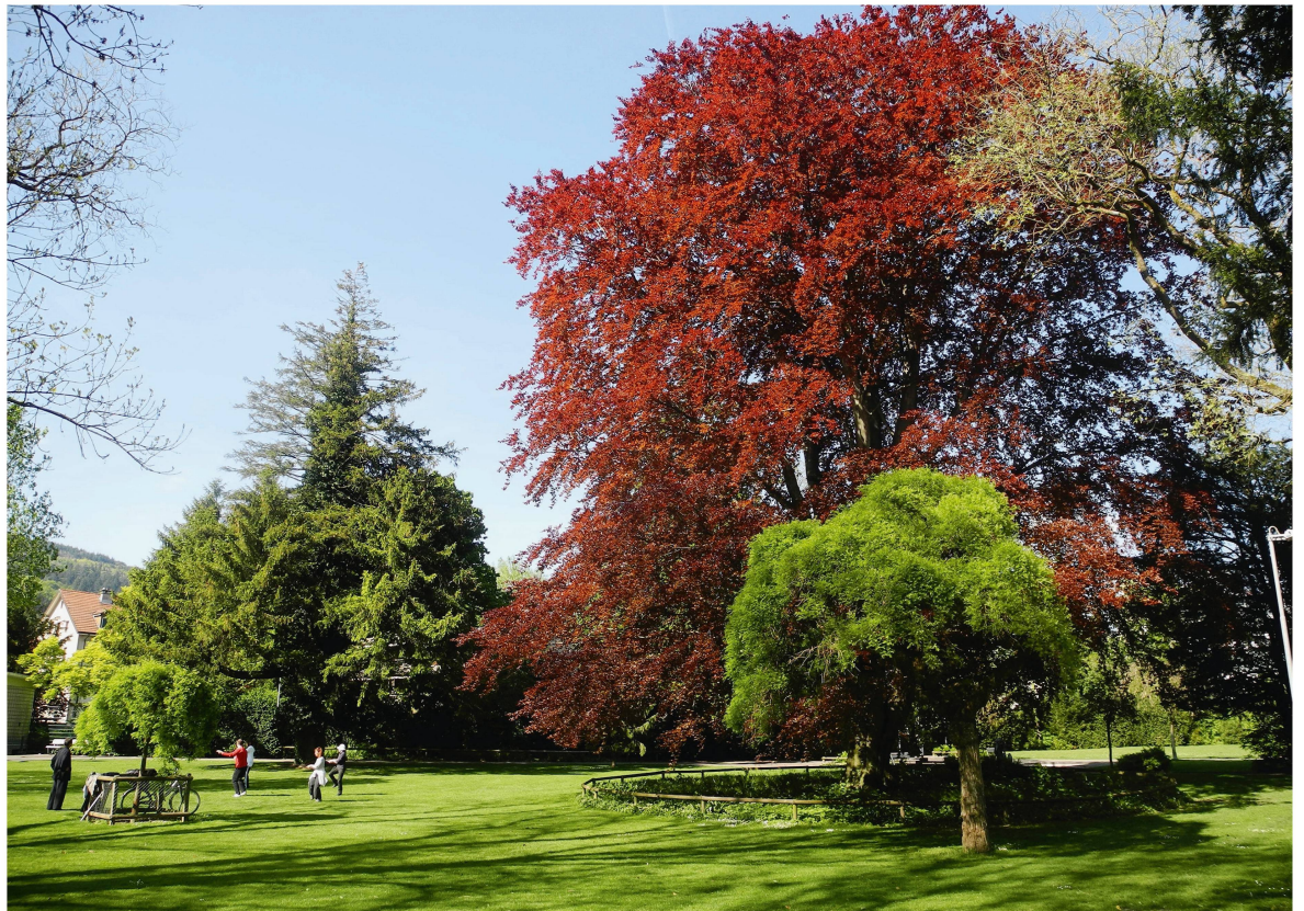
Abb 1 Bäume im Stadtpark Biel als Beispiel für die Vielfalt urbaner Baumformen.