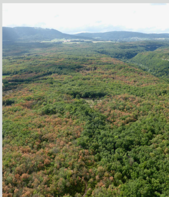
Trockenschäden an Flaum- und Traubeneichen bei La Sarraz (VD) auf flachgründigem Standort, auf- genommen am 27.7.2015.

Richtlinien für Autoren • Directives pour les auteurs • Author Guidelines www.forstverein.ch