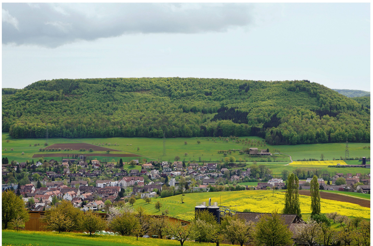
Abb 3 Das Verhältnis zwischen Wald-, Landwirtschafts- und Siedlungsgebiet ist ein aktuell viel diskutiertes, sektorübergreifendes Thema.