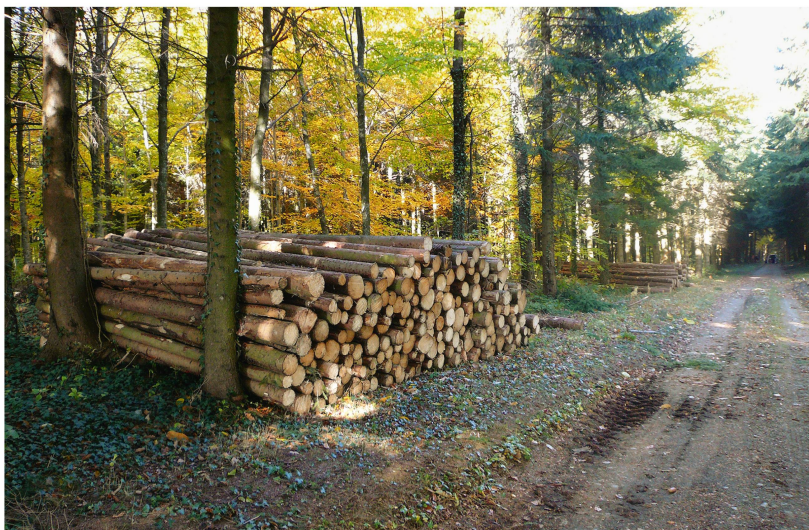
Abb 1 Hauptdiskussionspunkt in der Debatte zur Ergänzung des Waldgesetzes ist die Frage, ob der Aus- und Neubau (Optimierung) von Erschliessungsanlagen künftig auch im Nichtschutzwald mit Bundesbeiträgen unterstützt werden soll.

Bei der Diskussion über die Erschliessungsanlagen handelt es sich um eine «klassische» und dauernde Auseinandersetzung zwischen Naturschutzorganisationen und Forstwirtschaft. Es geht aber auch um das Dauerthema der Aufgabenteilung zwischen Bund und Kantonen. Der definitive Entscheid ist trotz komfortabler Mehrheit im Ständerat noch nicht gefallen, denn der Nationalrat hat im Mai 2014 mit 128 zu 30 Stimmen der Motion 12.3877 (von Siebenthal) zugestimmt, mit welcher die Förderung der Erschliessung ausserhalb des Schutzwaldes gefordert wird. Falls das Parlament beschliesst, den Neubau und die Sanierung von Erschliessungsanlagen künftig auch im Nichtschutzwald durch den Bund zu unterstützen, wird sich erst bei der mittelfristigen Finanzplanung und der jährlichen Budgetdebatte entscheiden, in welcher Höhe der Bund finanzielle Mittel dafür bereitstellen wird.