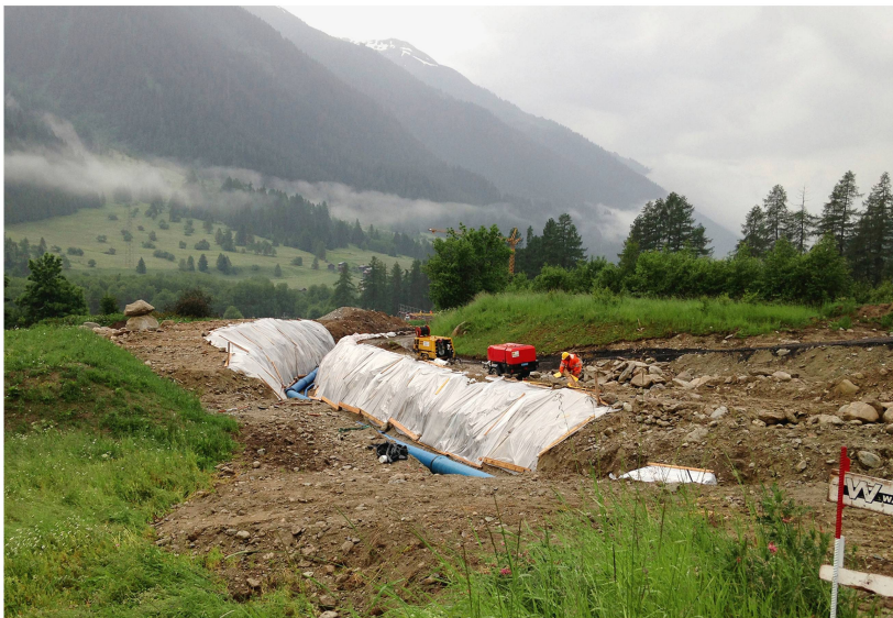
Abb 4 Kleinwasserkraftwerke stehen im Spannungsfeld zwischen der Produktion erneuerbarer Energie und dem Landschaftsschutz. Auf dem Bild der Bau eines Kleinwasserkraftwerkes am Walibach im Goms (Wallis).

folgen. Damit ist die Diskussion über den Einfluss von Stromleitungen auf das Landschaftsbild respektive auf das betroffene Ökosystem noch nicht abgeschlossen. Weiter wird mit dieser Strategie angestrebt, dass Netzausbauprojekte als Anlagen von nationalem Interesse deklariert werden können. Damit würde dieses Nutzinteresse auf die gleiche Stufe gehoben wie Schutzinteressen im Umweltbereich, was künftig zu einer neuen Interessenabwägung, insbesondere in Landschaften von nationaler Bedeutung, führen würde.