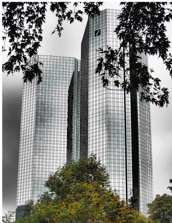
Abb 4 Urbane Grünflächen können zur Verbesserung des Mikroklimas beitragen.

In der Stadt haben Bäume und der Wald eine erhöhte symbolische Bedeutung. Es besteht eine Fülle an sehr hoch gesteckten Erwartungen an das urbane Grün, welche durch die vermehrt multikulturellen Prägungen von Städten sehr unterschiedlich sein können. Für die Waldpolitik im urbanen Raum bedeutet dies auch, dass sie sich mit den sozialen und