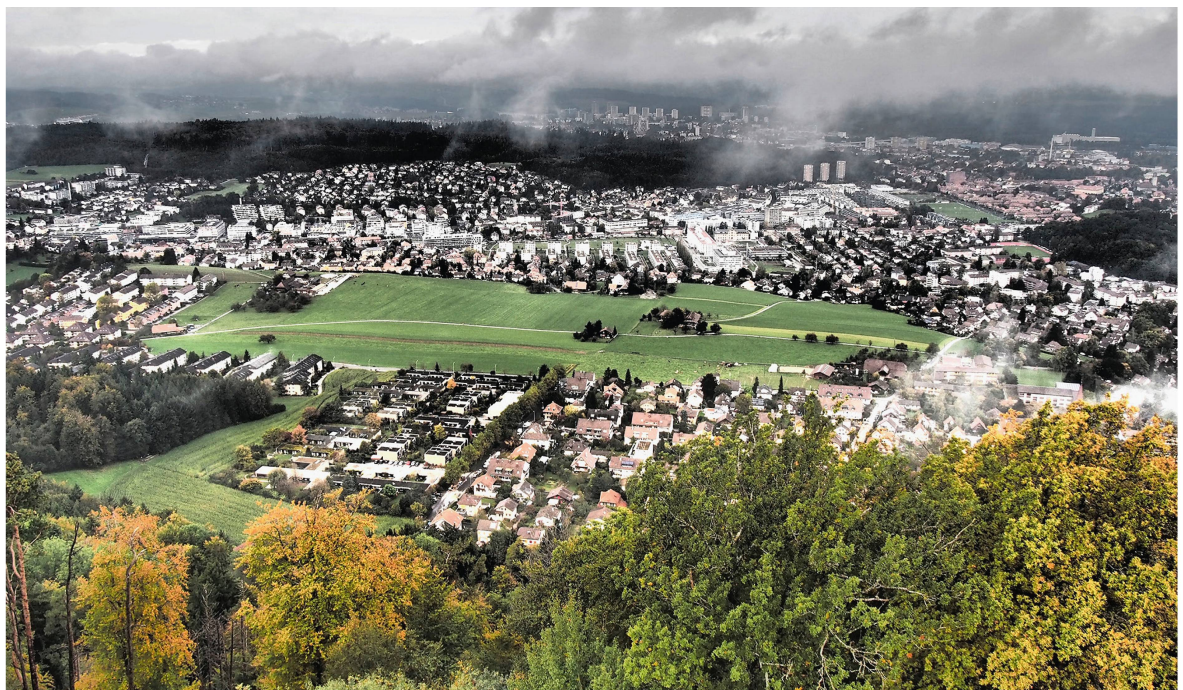
Abb 2 Urban Forestry betrifft sämtliche urbanen Frei- und Grünflächen im Siedlungsbereich mit Holzgewächsen – von Wäldern, Baumgruppen und Einzelbäumen über private und öffentliche Parks und Gärten bis hin zu Friedhöfen, Spielplätzen, Sport- und Freizeitanlagen.

1997, Konijnendijk et al 2000, 2005, 2006, Konijnendijk 2003), die zeigen, dass sich Urban Forestry als Thema, Disziplin und Wissensgemeinschaft weltweit etabliert hat. Mit einem Teilaspekt von Urban Forestry befasst sich die laufende COST Action FP1204 «Green Infrastructure approach: linking environmental with social aspects in studying and managing urban forests». 5