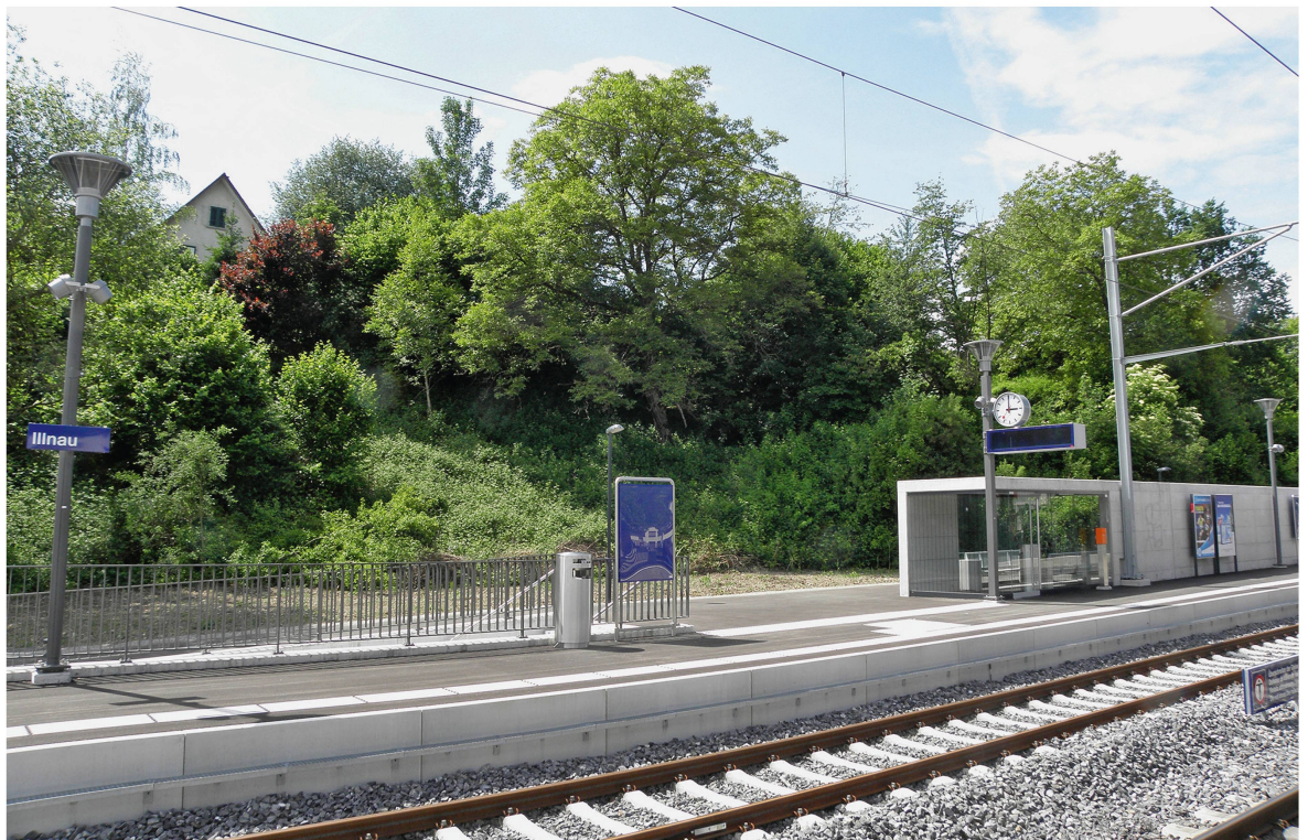
Abb 1 Blick auf ein Kleinstwäldchen mitten im Siedlungsgebiet.

Während sich also derzeit viel bewegt in der Schweizer Raumplanung, gibt es eine grosse Ausnahme: Der strikte Waldschutz blieb bislang tabu. Wald bedeckt fast ein Drittel der Landesfläche