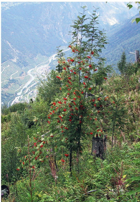
Fig. 3 Pro Noyet, surface ravagée par Vivian en 1990, avec rajeunissement du sorbier des oiseleurs en 2002.