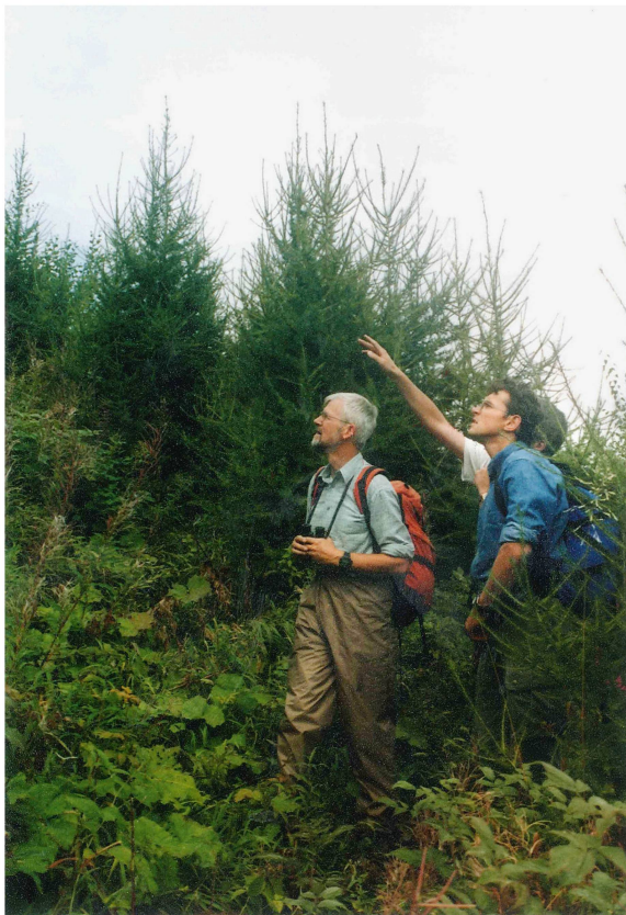
Fig. 2 Pro Noyet, surface ravagée par Vivian en 1990. Rajeunissement naturel du mélèze de plus de 2 m de hauteur en 2001. La surface a fait l'objet d'un projet de recherche suivi par le WSL et subventionné par l'OFEFP (actuellement OFEV).