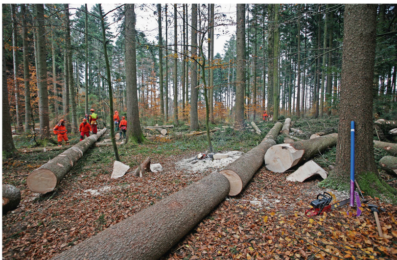
Abb 3 Durchforstungen beeinflussen das Sturmschadensrisiko in verschiedener Hinsicht. Auf jeden Fall setzen sie die kollektive Stabilität von Beständen vorübergehend herab.

stimmte Oberhöhe überschritten haben, tendieren Durchforstungen jedoch dazu, die Bestände zumindest temporär zu destabilisieren, im Wesentlichen dadurch, dass das Kronendach durchbrochen und dessen Rauigkeit damit erhöht wird. Da sich das Kronendach in der Regel innerhalb von zwei bis acht Jahren nach der Durchforstung wieder schliesst, erhöht sich das Sturmschadensrisiko eines Bestandes nach einer Durchforstung im Wesentlichen nur vorübergehend (Cremer et al 1982, König 1995, Schmid-Haas & Bachofen 1991). Eine Ausnahme sind verspätete, starke Durchforstungen, die dem spezifischen Alterstrend des Zuwachsverhaltens beziehungsweise des Reaktionsvermögens der jeweiligen Baumart zuwiderlaufen. Während Durchforstungen generell als ein möglicher Risikofaktor erkannt worden sind, ist derzeit noch unklar, wie bedeutend ihr Effekt ist verglichen mit demjenigen anderer Faktoren wie Baumart, Baumhöhe oder Schlankheitsgrad.