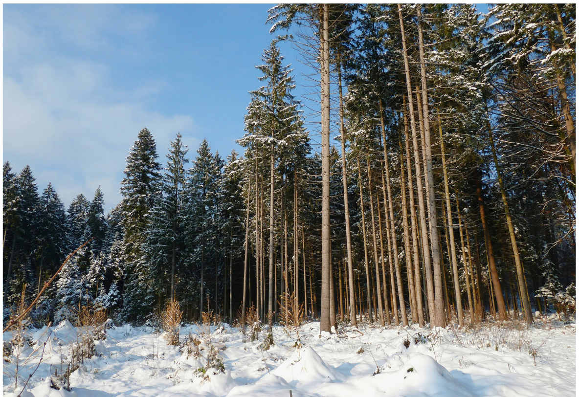
Abb 5 Steilränder erhöhen das Sturmschadensrisiko.

Verschiedene Studien weisen auf einen bedeutenden Effekt von in Windrichtung vorgelagerten