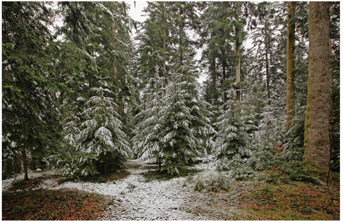
Abb 4 Strukturierte Bestände wie dieser Plenterwald sind winddurchlässiger, weshalb sie oft als weniger sturmanfällig betrachtet werden.

grafische, topografische und orografische Parameter hilfreich sein, um die Risikodisposition von Waldbeständen zu erklären (Saidani 2004, Schmoeckel 2005, Schindler et al 2009, Schindler et al 2012).