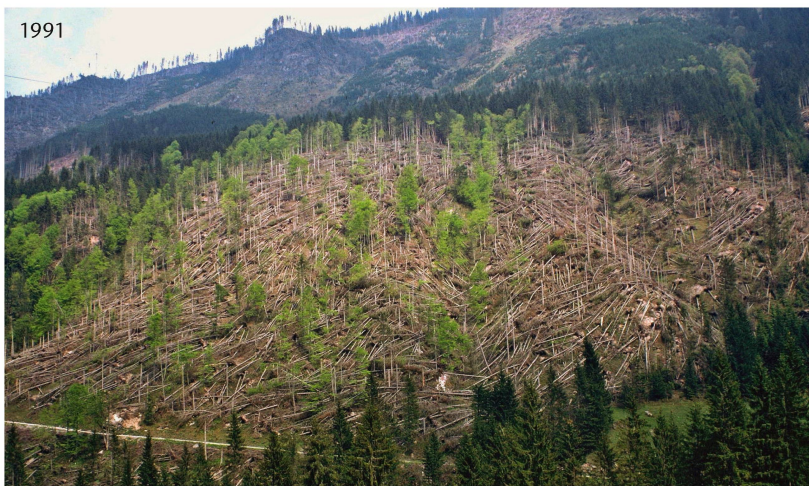
Abb 1 Die Sturmfläche Schwanden (Glarus) im Jahr 1991, d.h. ein Jahr nach Vivian: Die unbelaubten Buchen vermochten dem Sturm zu trotzen, die Nadelbäume wurden geworfen.