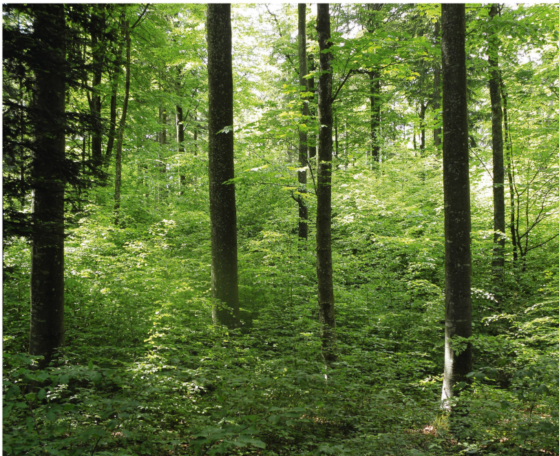
Abb 6 Die Möglichkeiten, Wintersturmschäden durch waldbauliche Massnahmen zu begrenzen, sind eher limitiert. Von zentraler Bedeutung ist dabei die Baumartenwahl, weil die winterkahlen Laubbäume weniger stark gefährdet sind als die wintergrünen Nadelbäume.