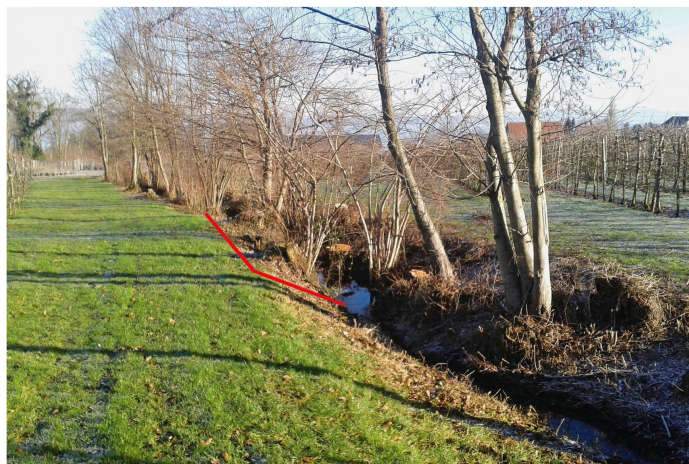
Abb 2 Typisches Ufergehölz im Oberthurgau. Rot: statische Waldgrenze.

Gemäss § 3 der Thurgauer Waldverordnung (RB 921.11) setzen sich Ufergehölze aus Waldbäumen oder Waldsträuchern zusammen, säumen oberirdische Gewässer, sind mindestens 15 Jahre alt und weisen in der Regel eine Ausdehnung von mindestens 20 m auf.