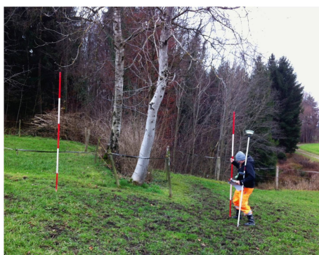
Abb 3 Waldfeststellung: Ab Stammmitte der äusseren Bäumen werden 2 m gemessen.

lung angewendet. Diese halten die Regeln und Kriterien des Forstamtes Thurgau bei der Anwendung der Rechtsgrundlagen für die Waldfeststellung schriftlich fest und gelten als verwaltungsinterne Instruktion. Mit dem Ziel, diese Regeln bekannt zu machen, wurden die Richtlinien auch an die Betroffenen, an die Gemeinden und an andere Verwaltungsstellen verteilt.