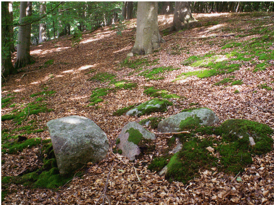
Abb 1 Die Entstehung ausgedehnter Moospolster dauert oft mehrere Jahrzehnte.