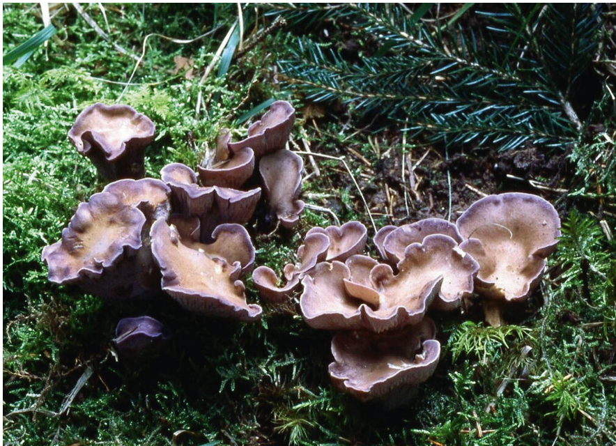
Abb 2 Das Schweinsohr ( Gomphus clavatus ) ist ein Naturnähezeiger und Indikator einer langwährenden standörtlichen Kontinuität (Nitare 2006). Die Art kann vor allem in Bergnadelwäldern auf Kalkböden nachgewiesen werden.

möglichst über relativ konstante Grundwasserhöhen und Boden(luft)feuchte einen dauerhaften Erhalt der Vorkommen von fruktifizierenden Pilzarten und deren Myzelsystemen im Boden alter Waldstandorte (Lüderitz 1993). Sinkenden Wasserständen können Pilzhyphen zeitweilig tiefer in den Boden nachfolgen, doch dauerhaftes Abführen von Wasser (z.B. über Entwässerungsgräben oder Drainagerohre) oder Änderung des Grundwasserpegels durch Trinkwassernutzung oder Klimaveränderungen führen langfristig zum Rückgang der pilzlichen Bodenbiomasse. Bei Störung können zum Beispiel etliche