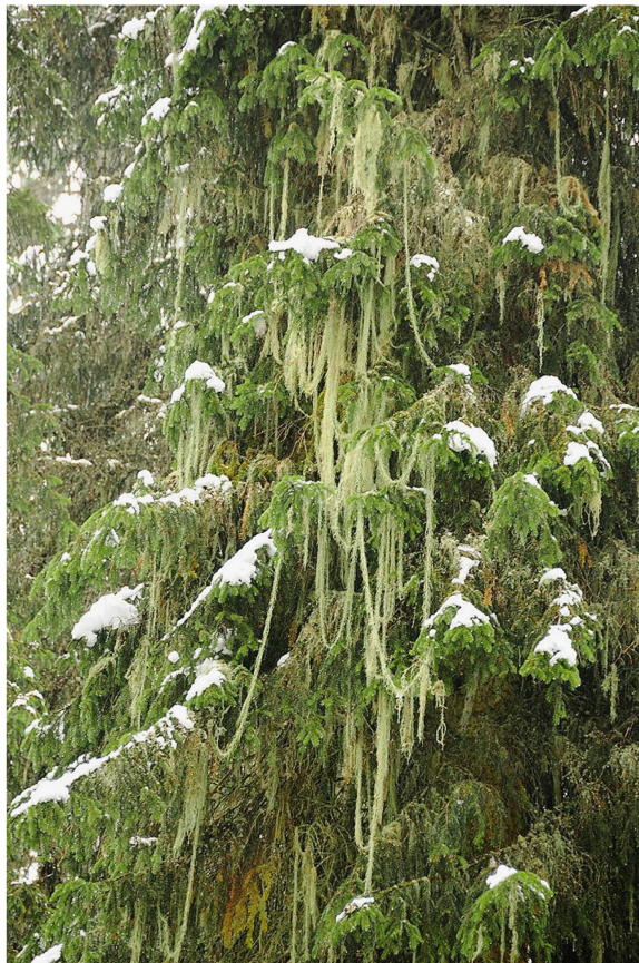
Abb 2 Flechtenwald mit der Engelshaarflechte ( Usnea longissima ) bei Muotathal.

und Calicium , aber auch die Eichen-Stabflechte ( Bactrospora dryina ) und die Feinfaserige Fleckflechte ( Arthonia byssacea ) genannt werden. Mit ihren hydrophoben Lagern nehmen sie Wasser nur in Form von hoher Luftfeuchtigkeit auf und wachsen nur an regengeschützten Kleinstandorten wie überhängende Stammseiten oder Borkenrisse.