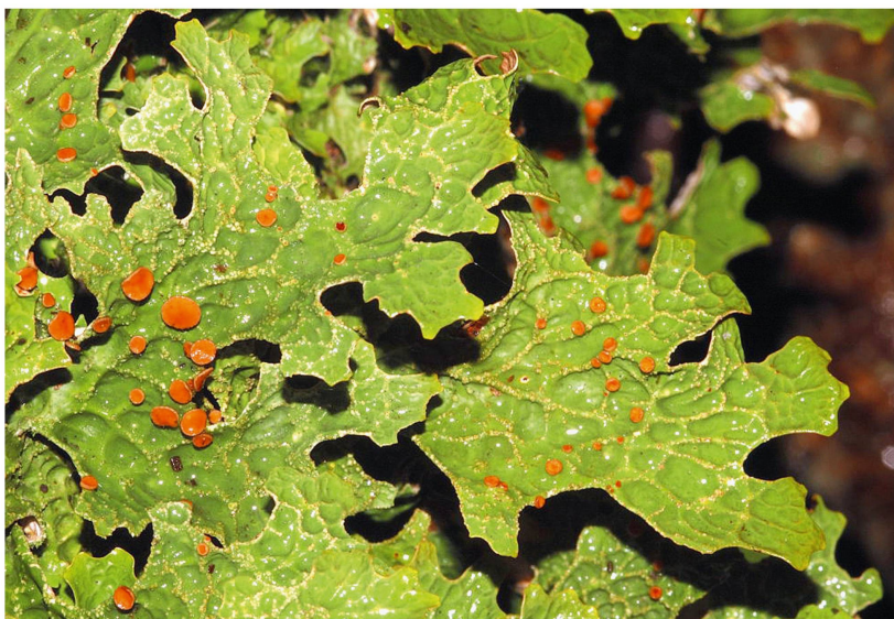
Abb 3 Die Echte Lungenflechte ( Lobaria pulmonaria ) weist in Europa ein grosses Verbreitungsgebiet auf, ist aber in bewirtschafteten Wäldern selten geworden.

den, oder durch spezialisierte, nur Bruchteile eines Millimeters grosse vegetative Ausbreitungseinheiten. Die körnig-mehligen vegetativen Ausbreitungseinheiten von Flechten (Soredien) sind deutlich grösser als Sporen und verfügen dadurch über ein stark eingeschränktes Ausbreitungsspektrum, was das gegenwärtige Verbreitungsmuster von zahlreichen baumbewohnenden Flechtenarten zu beeinflussen scheint (Dettki et al 2000, Sillett et al 2000).