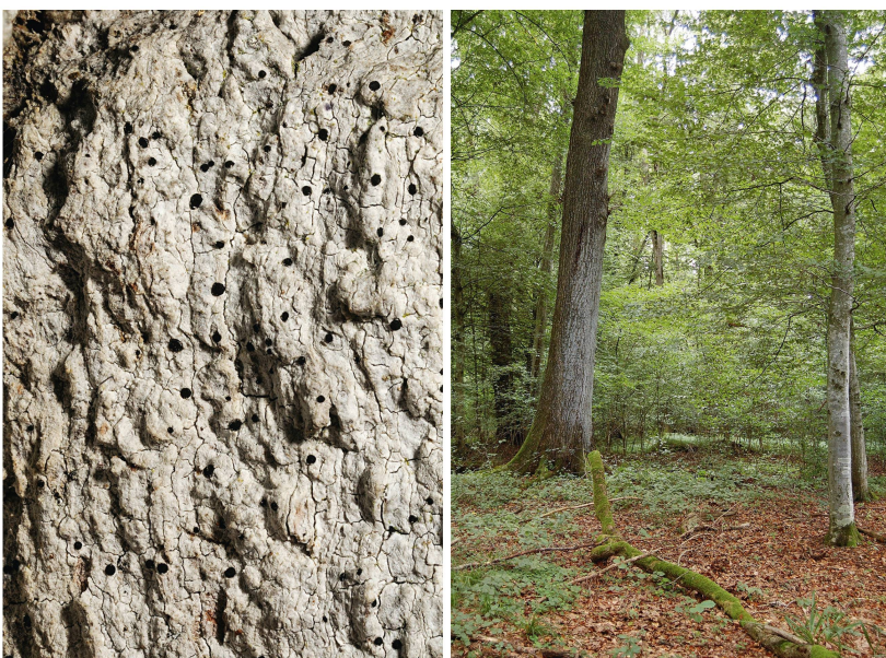
Abb 4 Die Eichenstabflechte ( Bactrospora dryina ; links) kann sich erst an über 90-jährigen Eichen (rechts) etablieren.