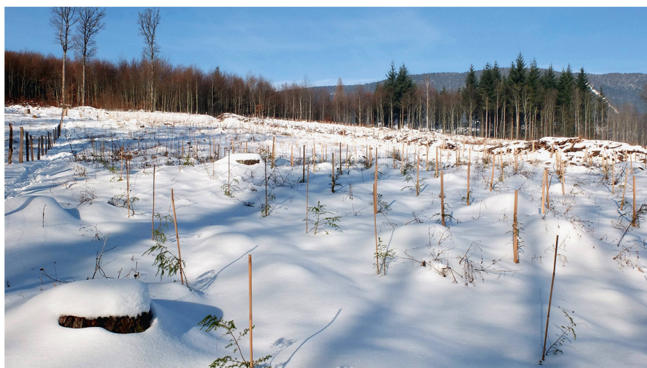
Fig. 2 La plantation expérimentale à Mutrux (VD) en hiver 2013/2014.

Le relevé de la mortalité au printemps 2014, soit une période de végétation après la plantation, a montré une bonne survie du tilleul argenté ( Tilia tomentosa ), du hêtre d'Orient ( Fagus orientalis ), de la pruche de l'Ouest ( Tsuga heterophylla ), du thuya géant ( Thuja plicata ) et une survie