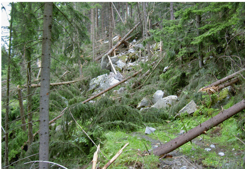
Abb 1 Die Hauptmasse des Sturzmaterials wurde beim Felssturz von 2006 in Gurtellen im Wilerwald abgelagert. Gemäss Thali (2006) wurden 75% der 8-m 3 -Steine und 20% der 20-m 3 -Steine vom Wald zurückgehalten. Die Energiereduktion durch den Wald bei einem 50-m 3 -«Stein» betrug hingegen lediglich rund 15%.

Obwohl im Titel des NaiS-Anforderungsprofils nur von Steinschlag gesprochen wird, gilt dieses auch für Blockschlag und sogar Felsstürze. Gemäss Definition von BRP et al (1997) treten bei Steinschlag Steine mit Durchmessern bis 0.5 m auf und bei Blockschlag Blöcke mit Durchmessern von 0.5 m bis zu einem Volumen von 100 m 3 . Bei grösseren Volumen wird von Felssturz gesprochen. Zur Vereinfachung verwenden wir in diesem Artikel den Begriff Steinschlag für alle relevanten Sturzgefahrenprozesse und den Begriff Stein für alle Sturzkomponenten, unabhängig von ihrer Grösse.