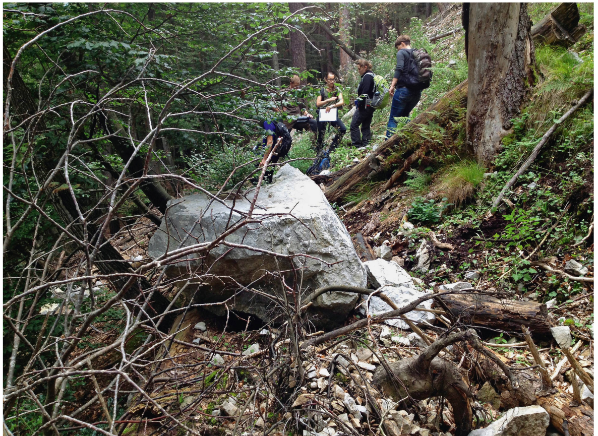
Abb 3 Dieser 1 m 3 grosse Stein wurde von einem alten liegenden Stamm im Salzacherwald (Merligen BE) gestoppt. Die übrigen Splitter (mehrere bis zu 0.5 m 3 ) wurden alle von stehenden Bäumen aufgehalten.

nis zu leisten vermag. Eine gute Datengrundlage ist die Voraussetzung für gute Ergebnisse bei der Berechnung der Schutzwirkung.