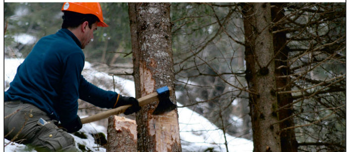
Handholzerkurs in Trin GR www.bergwaldprojekt.org

Bitte senden Sie Ihre Bewerbungsunterlagen bis am 28. Februar 2015 an den Kanton Glarus, Personaldienst, Rathaus, 8750 Glarus, E-Mail: personaldienst@gl.ch