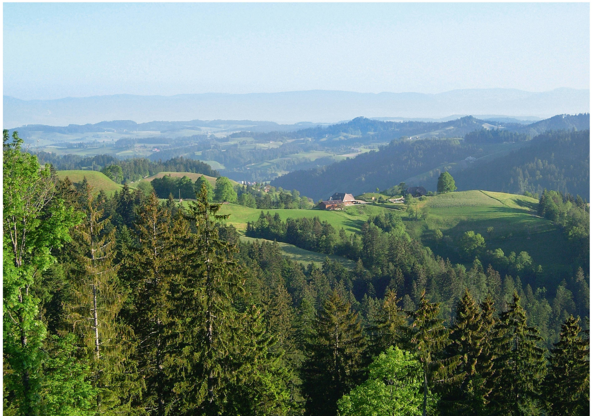
Abb 1 Einblick ins Emental (Kanton Bern), eines der privatwaldreichsten Gebiete der Schweiz.

etabliert. Urban wird dabei unterschiedlich definiert, zum Teil als ein in der Stadt wohnender Waldeigentümer oder noch breiter als Sammelbegriff für alle, die vom traditionellen, stereotypischen Bild des privaten Waldeigentümers abweichen (Weiss et al 2007, Krause 2011). Verschiedene Studien versuchen, diesen Begriff genauer zu fassen und die Eigenschaften des urbanen Waldeigentümers herauszustellen.