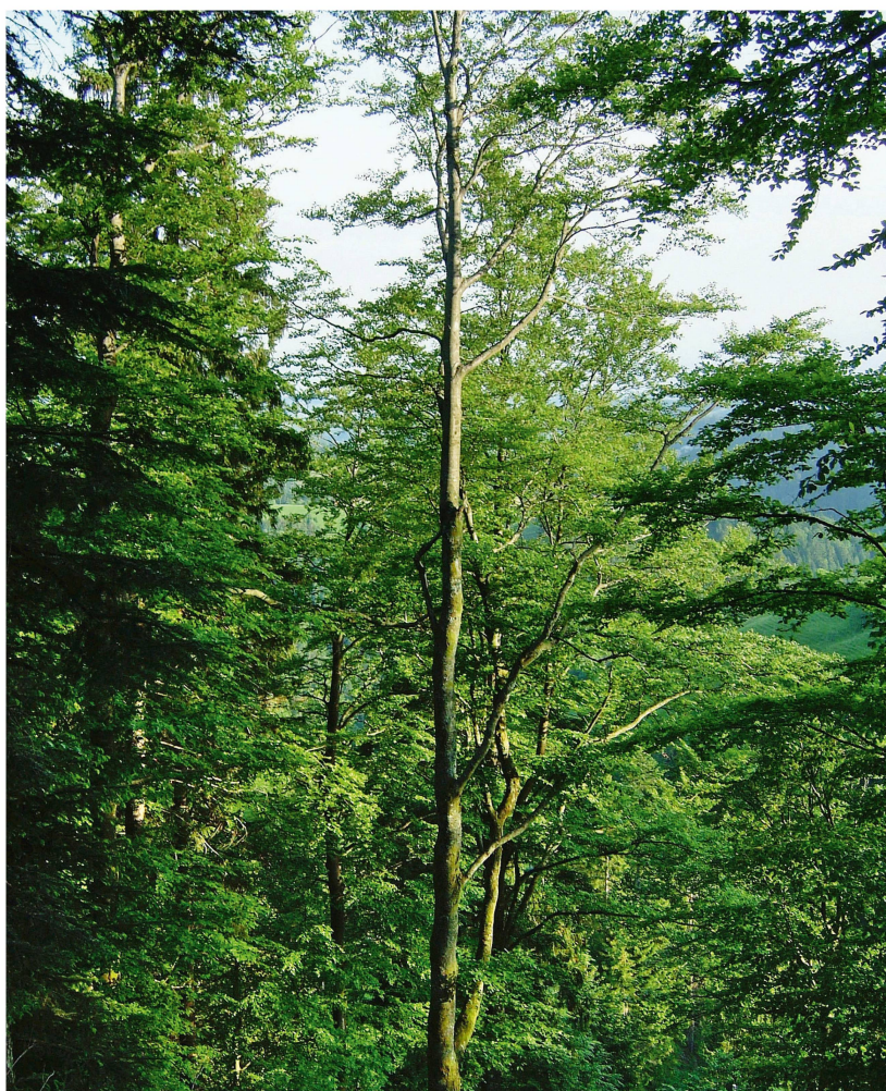
Abb 4 Für Waldeigentümer ohne landwirtschaftlichen Hintergrund ist die Erzielung von Einkommen aus dem eigenen Wald oft sekundär.

rechte komplett an Dritte abzugeben, kommt für die wenigsten infrage. Interesse scheint dagegen, besonders bei Personen mit landwirtschaftlichem Hintergrund, an der Verbesserung der Zusammenarbeit mit anderen Privatwaldeigentümern zu bestehen. Dies deutet auf ein Potenzial für den Ausbau von Zusammenschlüssen wie regionalen Organisationen hin (Mohr 2011, Rösli-Brun 2007).