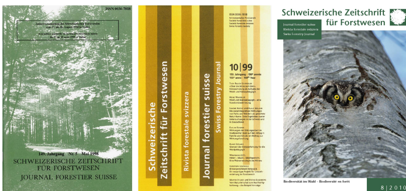
Abb 1 Titelblätter der SZF aus drei Epochen. Mit den Änderungen im Erscheinungsbild waren jeweils auch konzeptionelle Veränderungen verbunden.

Die SZF erschien im Laufe der Jahre in unterschiedlicher Aufmachung (Abbildung 1). Letztmals wurde die SZF im Jahr 2007 gründlich modernisiert. Der Schweizerische Forstverein (SFV) nahm seine Rolle als Herausgeber stärker wahr, passte die inhaltliche Ausrichtung sowie die Gestaltung an und wechselte zudem die Druckerei. Dies war mit erheblichen Umstellungskosten verbunden, die dazu beitrugen, dass das Vereinsvermögen auf unter CHF 50 000.– fiel, bei einem Jahresumsatz von rund CHF 450 000.–. Die finanziellen Risiken waren damit zu hoch. Der Vereinsvorstand hat während mehrerer Jahre und schliesslich durchaus mit einem gewissen Erfolg (siehe Jahresrechnung 2013/2014) nach Lösungen für dieses Problem gesucht. Da die SZF rund 60% des Vereinsbudgets ausmacht, wurde aber klar, dass zu einer nachhaltigen Verbesserung der Fi-