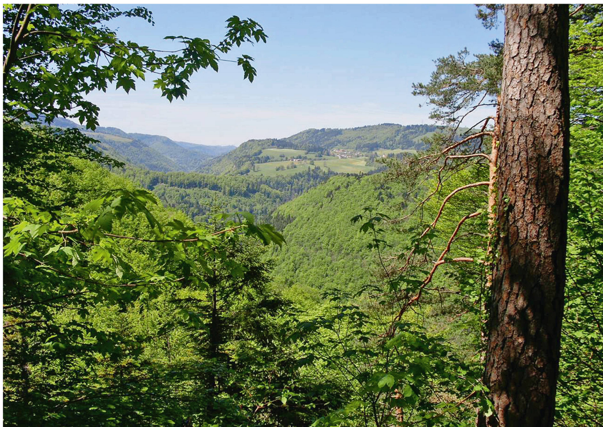
Fig. 1 Une forêt omni-présente dans le paysage, à l'image de la vallée du Doubs.

le sapin et l'épicéa, qui constituent ensemble 80% d'un volume sur pied qui continue d'augmenter. Il s'établit à la valeur très élevée de 411 m 3 /ha. La diminution des résineux est, quant à elle, perceptible dans le paysage. Elle reflète l'évolution naturelle du rajeunissement sur des stations de hêtraies, la réduction drastique de l'investissement dans les plantations et l'effort entrepris par les propriétaires en vue de diversifier les essences dans les travaux de soins et d'éclaircie. Elle démontre aussi la primauté et l'importance centrale du résineux pour le marché du bois. A cela s'ajoutent d'importants volumes de résineux abattus par l'ouragan Lothar ou attaqués par les scolytes durant les années qui ont suivi. Le volume de bois annuellement mis sur le marché s'élève à environ 190 000 m 3 , soit une valeur clairement inférieure à l'accroissement que connaît la forêt jurassienne. Le potentiel actuellement inexploité est estimé à 30 000 m 3 par année.