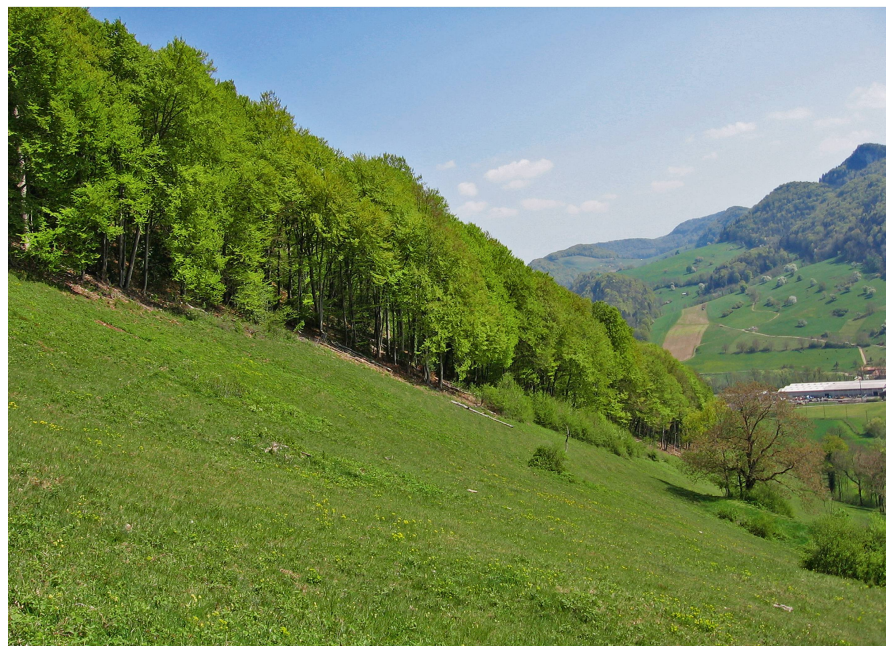
Fig. 3 Travaux de valorisation d'une lisière à proximité d'une prairie sèche. Delémont (JU).

Le Jura a connu une nette avancée de la forêt entre les années 1950 à 1990. Le boisement s'est développé sur des surfaces marginales abandonnées par l'agriculture et suite à diverses plantations sub-