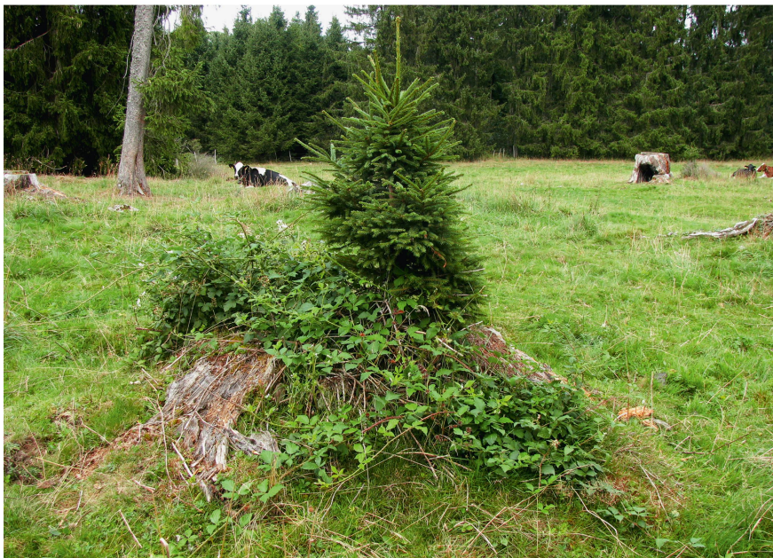
Fig. 5 L'ensemble des thématiques en lien avec la pérennisation du pâturage boisé sont résumées en une image! Franches-Montagnes (JU).

ventionnées à l'époque (souvent avec des épicéas). La récente mise à jour de la mensuration officielle a conduit à la suppression de paiements directs agricoles sur d'importantes surfaces déjà en nature de forêt. Certains domaines agricoles ont ainsi dû faire face à une réduction conséquente des ressources financières perçues. Cette situation a conduit à des défrichements illicites en vue de «récupérer de la surface agricole utile». La loi sur les forêts, et plus directement le service forestier dans sa mission de conservation de l'aire forestière, sont alors au cœur des discussions, bien que ces surfaces aient été abandonnées voici plusieurs décennies. Dans les secteurs présentant des intérêts publics importants (prairies