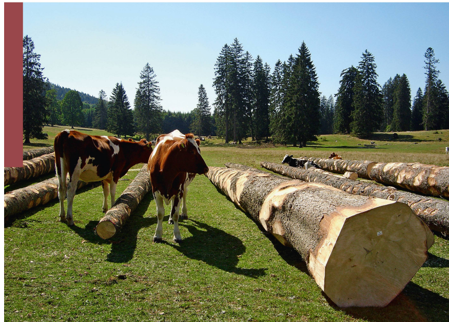
Fig. 6 Bois de qualité très médiocre, typique des pâturages boisés, avec le bétail comme acteur incontournable pour le maintien du paysage sylvopastoral. Franches-Montagnes (JU).