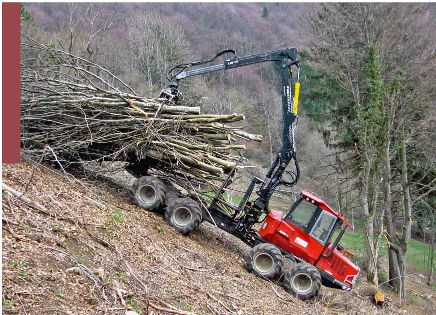
Fig. 4 Travaux conséquents en vue de la revitalisation d'un pâturage boisé sec totalement refermé. Montmelon (JU).