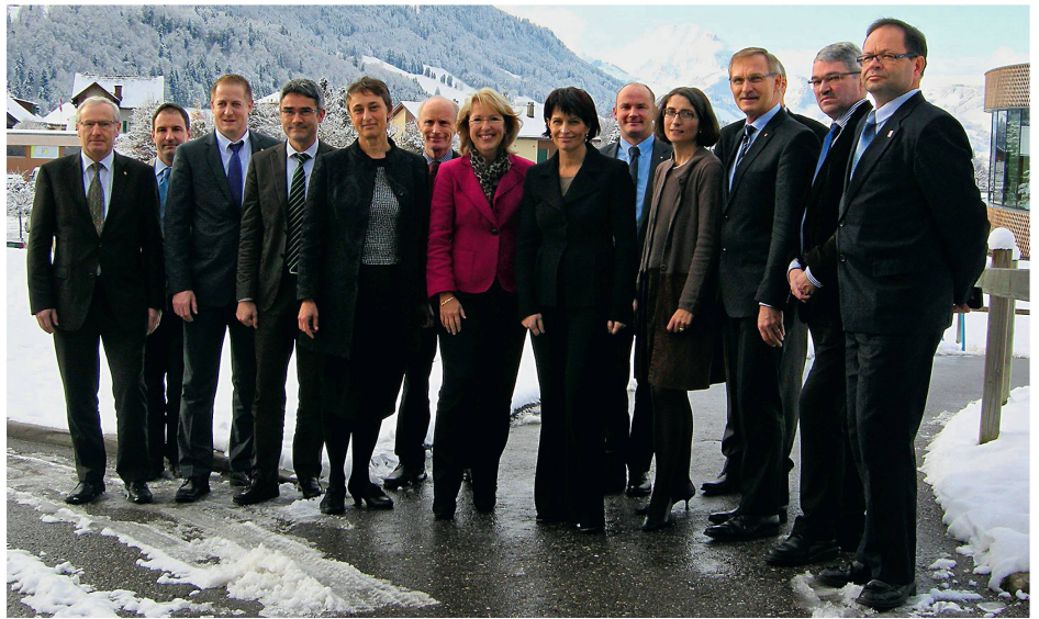
Abb 1 Bundesrätin Doris Leuthard mit FoDK-Mitgliedern anlässlich der Herbsttagung vom 22. November 2013 in Charmey (FR).

Gestützt auf diese Ausgangslage haben sich FoDK und BAFU/UVEK unter Berücksichtigung der Vernehmlassungsergebnisse auf eine gemeinsame Überarbeitung der WaG-Revision geeinigt. Dabei soll das Ziel, dass der Bundesrat die Vorlage noch vor den Sommerferien dem Parlament vorlegen kann, weiterverfolgt werden. Die Arbeiten sind inzwischen weit fortgeschritten. Dank der verstärkten