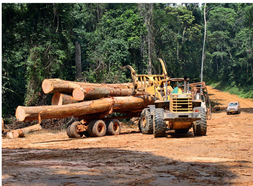
Abb 2 Muss die Anforderungen der EU Timber Regulation (EUTR) beim Import in die Europäische Union ebenfalls erfüllen: Forstwirtschaft in Gabun.

die EUTR die Akkreditierung von sogenannten Überwachungsorganisationen durch die Europäische Kommission vor. Diese entwickeln ein Due Diligence System (DDS), stellen es interessierten Marktteilnehmern zur Verfügung, kontrollieren dessen Einhaltung und unterrichten im Fall von Verstößen die zuständigen Behörden (Abbildung 3).