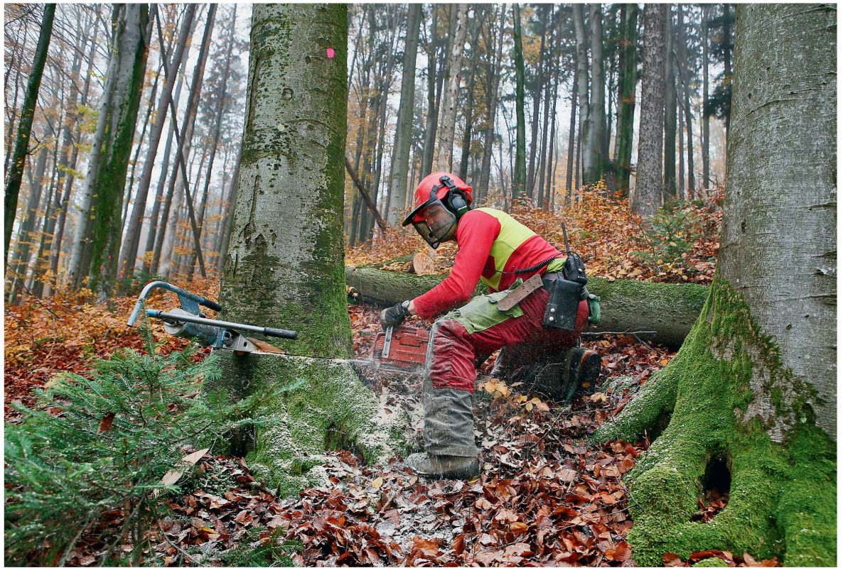
Abb 4 Produziert auch für den Export: Forstwart bei der Holzernte.

in den einzelnen EU-Mitgliedsstaaten und der Substituierbarkeit der Schweizer Produkte im EU-Binnenmarkt abhängig. Viele Experten betonten auch die Wichtigkeit guter Handelsbeziehungen zu den EU-Kunden.