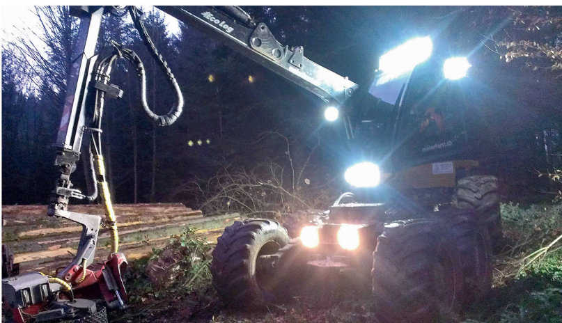
Abb 5 Vereinzelt wird befürchtet, dass mit einer Implementierung der EUTR-Forderungen in das USG die ökonomischen Aspekte weniger stark berücksichtigt würden als die ökologischen: Harvester im Schweizer Wald.

Einige der befragten Experten würden eine Staatsgarantie klar als eine Untermauerung des