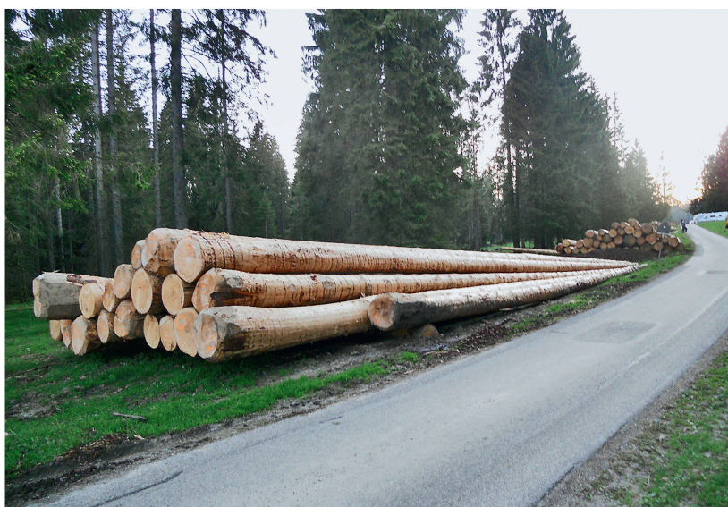
Abb 6 Schweizer Waldholz dürfte als unbedenklich im Sinne der EUTR gelten: Langholzpolder bei Le Bémont (JU).

Eingereicht: 7. Oktober 2013, akzeptiert (mit Review): 27. November 2013