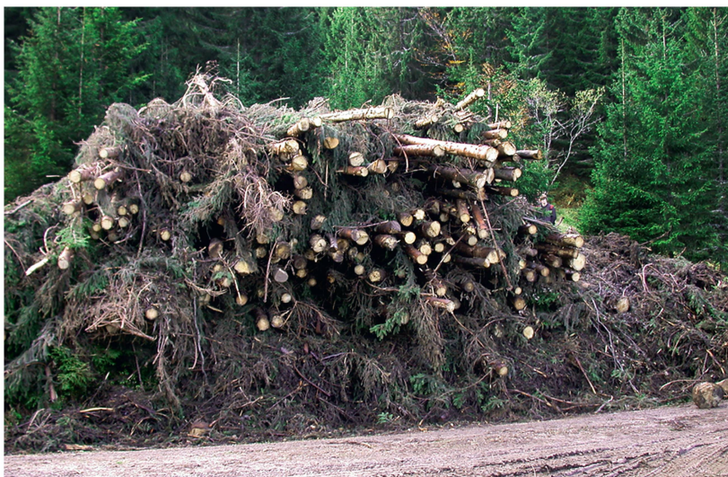
Abb 4 Reisigmaterial.

renzsituation aus. Allerdings sind mittelfristig die Einschlagsmöglichkeiten durch die Grundsätze der Nachhaltigkeit begrenzt. Die Analyse und Interpretation der Ergebnisse der Bundeswaldinventur 2 (BMELV 2004) (und demnächst auch der Bundeswaldinventur 3) gibt hier auf Grossregionen bezogene klare Anhaltspunkte und Grenzwerte, die nach Baumartengruppen und Altersklassen gegliedert sind und damit die langfristige biologische Leistungsfähigkeit der Waldbestände differenziert berücksichtigen. Die in der Bundeswaldinventur erfasste Geländesituation und Erschliessung einerseits und Waldbesitzart andererseits lassen erkennen, dass auch technische Gesichtspunkte und die Zielsetzung der jeweiligen Waldeigentümer die bisherige Nutzungsintensität entscheidend bestimmen. «Nutzungsreserven» finden sich danach einerseits in eher steilem Gelände und andererseits im kleinen Privatwald, der sich in bäuerlichem oder auch im Besitz von Städtern (urbane Waldbesitzer) befinden mag. Verbesserte Waldinfrastruktur, der Einsatz spezieller Nutzungstechnik für Hanglagen, aber auch Aufklärung und Schulung der Waldbesitzer in Bezug auf die Zusammenhänge zwischen Zuwachs, Nutzung und Bestandesstabilität sind möglicherweise zielführende, aber erst mittelfristig wirksame Massnahmen zur Mobilisierung vorhandener Nutzungsreserven (Reger 2013).