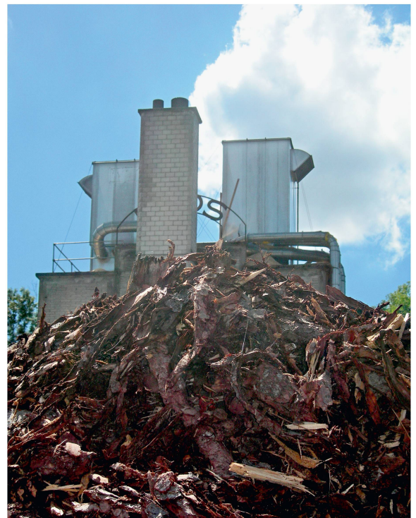
Abb 6 Konkurrenz kann sich auch auf dem Industrierestholzmarkt ergeben.

aber auch wegen des aufgrund des geringeren Wassergehalts höheren Heizwerts dieses industriellen Materials erscheint es grundsätzlich zielführend, die energetische Verwendung in diesem Bereich weiter auszubauen. Im Vergleich zur thermischen Verwertung von waldfrischem Industrie- oder Restholz (Holzfeuchte 70–100%) ermöglichen trockenere Restholzsortimente (Holzfeuchte 15–30%) eine mindestens doppelt so hohe Energieausbeute. Auch bei der Bereitstellung von Waldholz können im Übrigen, wenn Vortrocknungseffekte, zum Beispiel durch Zwischenlagerung in grossen Reisighaufen, genutzt werden, ähnliche Effekte erzielt werden. Die energe-