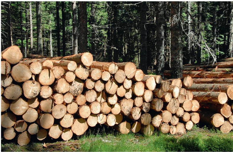
Abb 2 Fichten-Schleifholz-Polter.