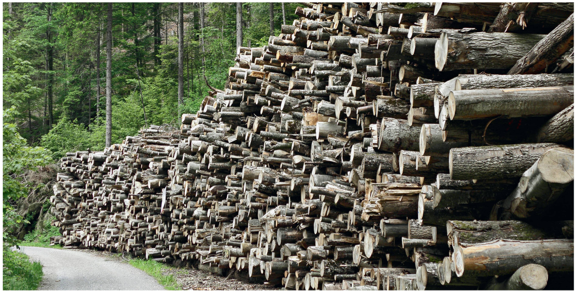
Abb 5 Aushaltung nach dem Stammholz-Plus-Konzept mit viel Energieholz.

Hieb die ganze Palette möglicher Produkte ausgehalten und vermarktet wird, sondern dass in Gebieten und Perioden mit hoher Energieholznachfrage nebst (gutem) Stammholz ausschliesslich Energieholz ausgehalten wird (Stammholz-Plus-Konzept), wodurch entscheidende Holz mengen in den Energieholzsektor hinein gelenkt werden können (Abbildung 5). Umgekehrt wäre in Regionen und Situationen, in denen die Energieholznachfrage wenig ausgeprägt ist oder sie auf einen entspannten Markt trifft, eine Energieholz minimierende Aushaltung vorzunehmen, indem hier alle von der Holzindustrie zur stofflichen Verwertung nachgefragten Sortimente (Stammholz guter bis mässiger Qualität und Industrieholz) ausgehalten werden. Dies könnte die Konkurrenzsituation entzerren und zugleich einen Beitrag zur einer transportoptimierten Stoffstromlenkung leisten, indem gemäss dem Konzept vom «Holz der kurzen Wege» Holz mengen mit im Grunde identischen Eigenschaften nicht parallel zu verschiedenen Kunden transportiert werden, sondern eine frühzeitig nach Kundenbedarf und Lieferentfernung optimierte Rohholzallokation vorgenommen wird.