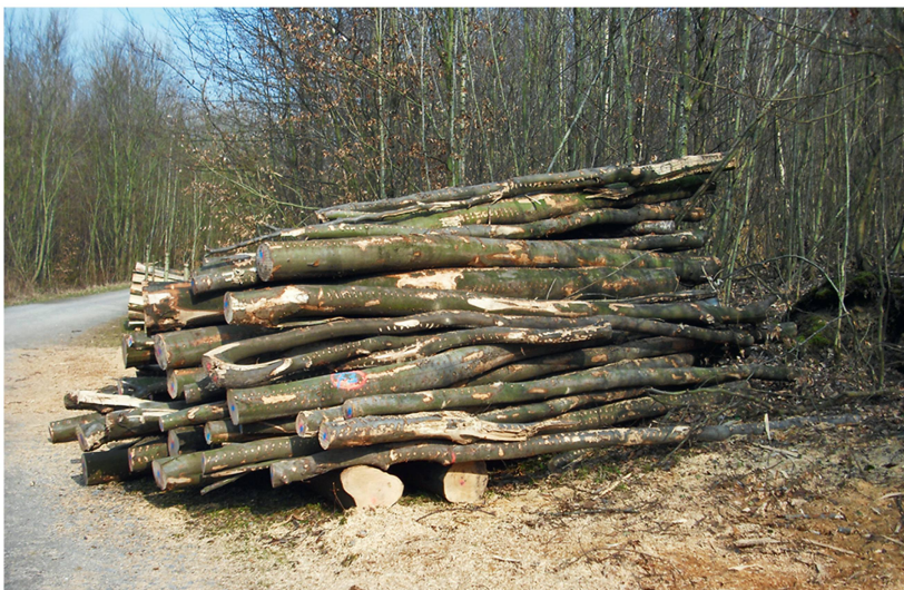
Abb 3 Buchen-Industrieholz-Polter.

Hier kommt hinzu, dass in den vergangenen Jahren massgebliche Schleifholz verarbeitende Kapazitäten aus dem Markt genommen wurden (Rathke 2013, Wolf & Borchert 2010), sodass die Nachfrage nach stofflich eingesetztem Fichtenschwachholz deutlich gefallen ist und eine energetische Verwendung vielerorts als einzige Alternative bleibt.