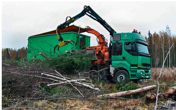
Abb 1 Ein Chipper-Chip-Truck im Einsatz.

werden aus Holz 25 682 MW Wärme und 905 MW Strom erzeugt, wobei die Elektrizitätsproduktion aus Holz in den letzten zehn Jahren deutlich gestiegen ist (Kaufmann 2013). Bei Kleinf Feuerungen, die einzelne Wohnobjekte beheizen, kommen Stückholz, Hackgut und Pellets zum Einsatz. Letztere sind Presslinge aus Nebenprodukten der Sägeindustrie und werden hier nicht behandelt, ebenso wenig wie das Stückholz. Heizwerke für Nah- und Fernwärme setzen meist Hackgut ein, wobei die Materialanforderungen, insbesondere an die Grössenverteilung und den Feuchtegehalt, auf die jeweilige Feuerung abzustimmen sind. Grosse Werke haben Feuerungssysteme, die relativ feuchtes Gut akzeptieren, und bei grossen Rostfeuerungen wird auch Grobanteil im Hackgut toleriert. Die Analyse und Optimierung von Transportketten ist vor allem bei grossen Abnehmern wirtschaftlich interessant, so beziehen sich die in der Folge dargestellten Transportketten vorwiegend auf die Versorgung von grösseren Heizwerken oder Biomassehöfen (Letztere erlauben auch die Distribution an Kleinstverbraucher) mit Hackgut.