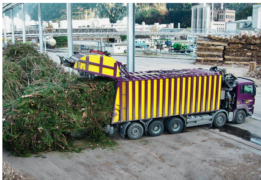
Abb 3 Ein neu entwickelter und in Graubünden im Einsatz stehender Biomasse-Transporter.

Energieholz wird fast immer mit dem LKW aus dem Wald abtransportiert, da die geografische Verteilung und Erschliessung der Wälder nichts anderes zulässt (Allen et al 1998). Für lokale Transporte wer-