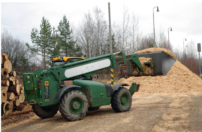
Abb 2 Radlader werden für den werksinternen Transport oder für das Verladen von Hackgut in den Terminals eingesetzt.

lumens (Kärhä 2011; Abbildung 1). Das Hacken von diversen Energieholzsortimenten direkt auf der Forststrasse ist weit verbreitet und ist mit zahlreichen anwendungsbezogenen Forschungsarbeiten dokumentiert sowie analysiert worden: für Nordeuropa (z.B. Ranta & Rinne 2006, Kärhä 2011), Mitteleuropa (z.B. Spinelli et al 2007, Stampfer & Kanzian 2006) sowie Nordamerika (z.B. Mahmudi & Flynn 2006) und Japan (z.B. Yoshioka et al 2006). Circa 70% der in Finnland jährlich erzeugten Menge an Energieholz wird auf der Forststrasse gehackt (Ranta & Rinne 2006). In Österreich werden ungefähr zwei Drittel des Energieholzes an der Forststrasse gehackt und per LKW direkt zu den Abnehmern gebracht (Rauch & Gronalt 2011). Wenn der LKW direkt über den Auswurfarm des Hackers beladen wird, führt die enge Verzahnung der Prozesse dazu, dass sich Verzögerungen stark auf die Wirtschaftlichkeit der Bereitstellungskette auswirken. Eine Vorkonzentration von Energieholz auf zentralen Hackplätzen sowie die Entkoppelung der Prozesse Hacken und Transport können dieses Problem lösen. Letzteres ist speziell im Gebirgswald unumgänglich, da häufig nicht ausreichend Platz vorhanden ist, um Hacker und LKW nebeneinander zu positionieren (Stampfer & Kanzian 2006). Findet die Beladung unabhängig vom Hacken statt, wird das Gut auf die Forststrasse gehackt, und die LKW sind mit einem Ladekran ausgestattet (Ranta & Rinne 2006). Vor dem Hacken kann das Material zur Trocknung gelagert werden.