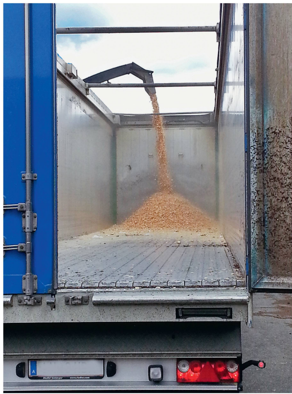
Abb 4 Sattelzug mit Schubboden.

den auch landwirtschaftliche Gespanne eingesetzt, bei grösseren Entfernungen (ab 50 km Transportdistanz) ist der Einsatz von Sattelzügen empfehlenswert (Spinelli & Hartsough 2001). Die eingeschränkte Befahrbarkeit vieler Forststrassen begrenzt besonders im Alpenraum den ansonsten wirtschaftlich vorteilhaften Einsatz von Sattelzügen mit Schubboden (Abbildung 4). Um das zulässige Ladungsgewicht tunlichst auszunutzen, soll die Schüttdichte möglichst hoch sein, was bei Hackgut beispielsweise durch die Beschleunigung im Hackerauswurf oder geringfügiges Anheben und Fallenlassen von ACTS-Containern erreicht wird (Talbot & Suadicani 2006). ACTS-Container auf LKW mit Hakengerät haben den Nachteil der hohen Eigengewichte (zwei bis drei Tonnen höhere Eigengewichte im Vergleich zum Standard-LKW; Spinelli & Hartsough 2001). Es besteht auch die Möglichkeit, Container als Transportmittel und als Behälter für die Trocknung zu verwenden. Zur Trocknung wird Warmluft, zum Beispiel aus Abwärme von Biogasanlagen, eingesetzt, wobei manche Systeme hierzu mit einem perforierten Zwischenboden ausgestattet sind, während andere einen zentralen, perforierten Zuluftschacht aufweisen (Mobiltrockner). 3