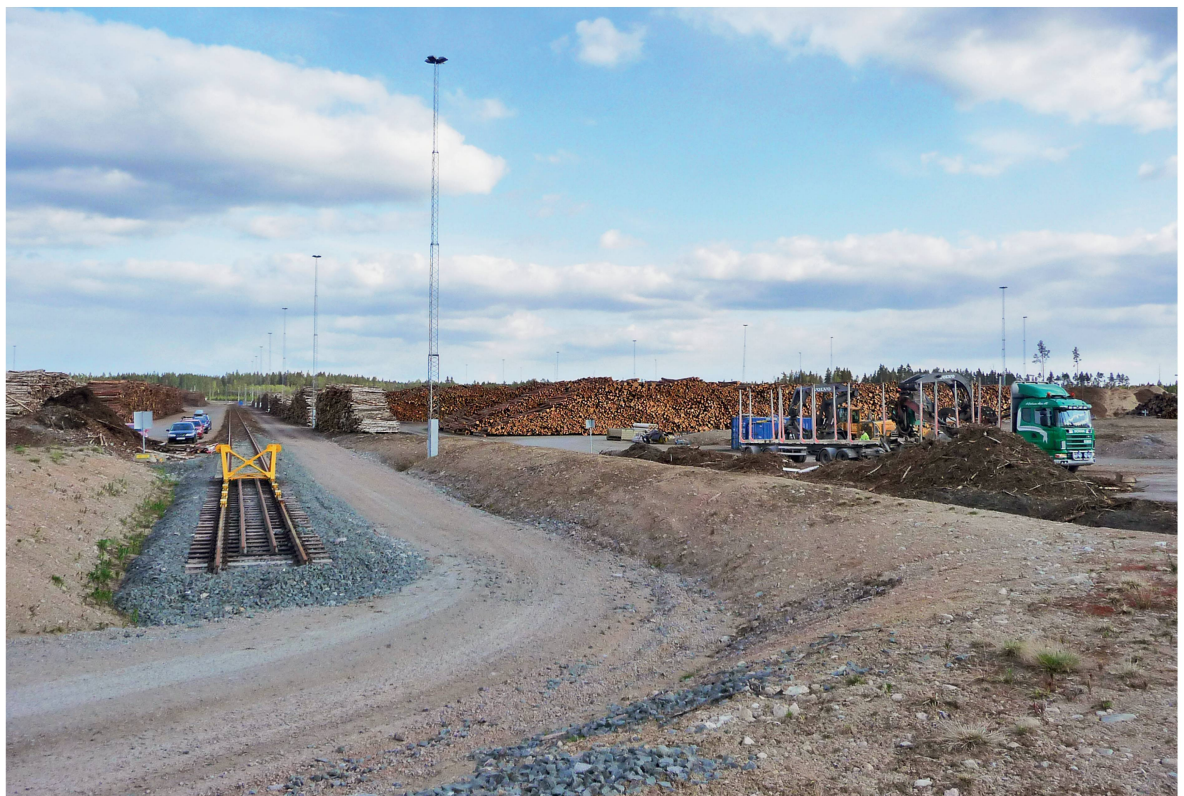
Abb 6 Bahnterminal in Stockaryd, Schweden: Auf dem Verladegleis können Ganzzüge mit 700 m Länge beladen werden.