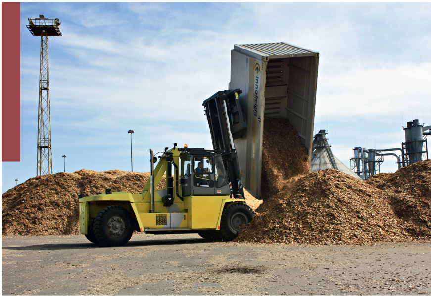
Abb 5 Drehentladestapler beim Entladen eines Wood Tainer.

müssen. Im Gegensatz zu Deutschland und Österreich hat der Schiffstransport in der Schweiz kaum Potenzial.