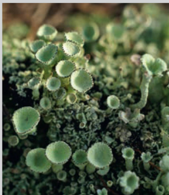
Nahaufnahme einer Flechte ( Cladonia sp. ) auf einem liegenden Lärchen- stamm.

Inserate • Annonces • Advertisements Stämpfli Publikationen AG, Inseratemanagement, Wölflistrasse 1, Postfach 8326, CH-3001 Bern Telefon +41 31 300 63 89, Fax 63 90, inserate@staempfli.com 1120 Exemplare (durchschnittlich verkaufte bzw. abonnierte Auflage, notariell beglaubigt). Anzeigenschluss: jeweils am 15. des Vormonates oder nach Vereinbarung. Erscheinungsdatum: jeweils am 3. des Monats.