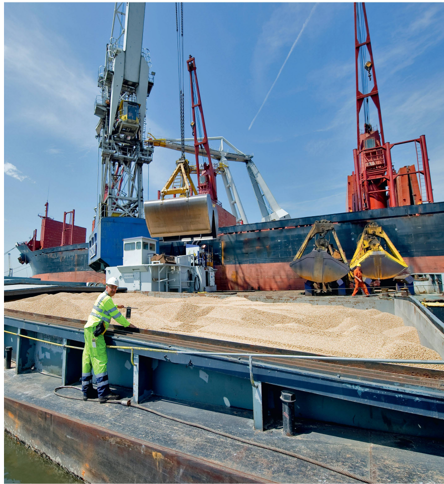
Abb 3 Nach 14 Tagen auf hoher See erreichte im Juni 2011 das erste mit rund 23 Tonnen Holzpellets beladene Schiff aus Georgia den niederländischen Seehafen Dordrecht, von wo die Pellets per Schubkahn weiter zum Kohlekraftwerk Amercentrale der niederländischen RWE-Tochter Essent transportiert wurden.

stehen solche mit Überschüssen gegenüber. Bisher konzentriert sich der Handel mit Biomasse zwar überwiegend auf lokale Märkte (Abbildung 2), es wird aber ein starkes Wachstum im internationalen Handel erwartet.