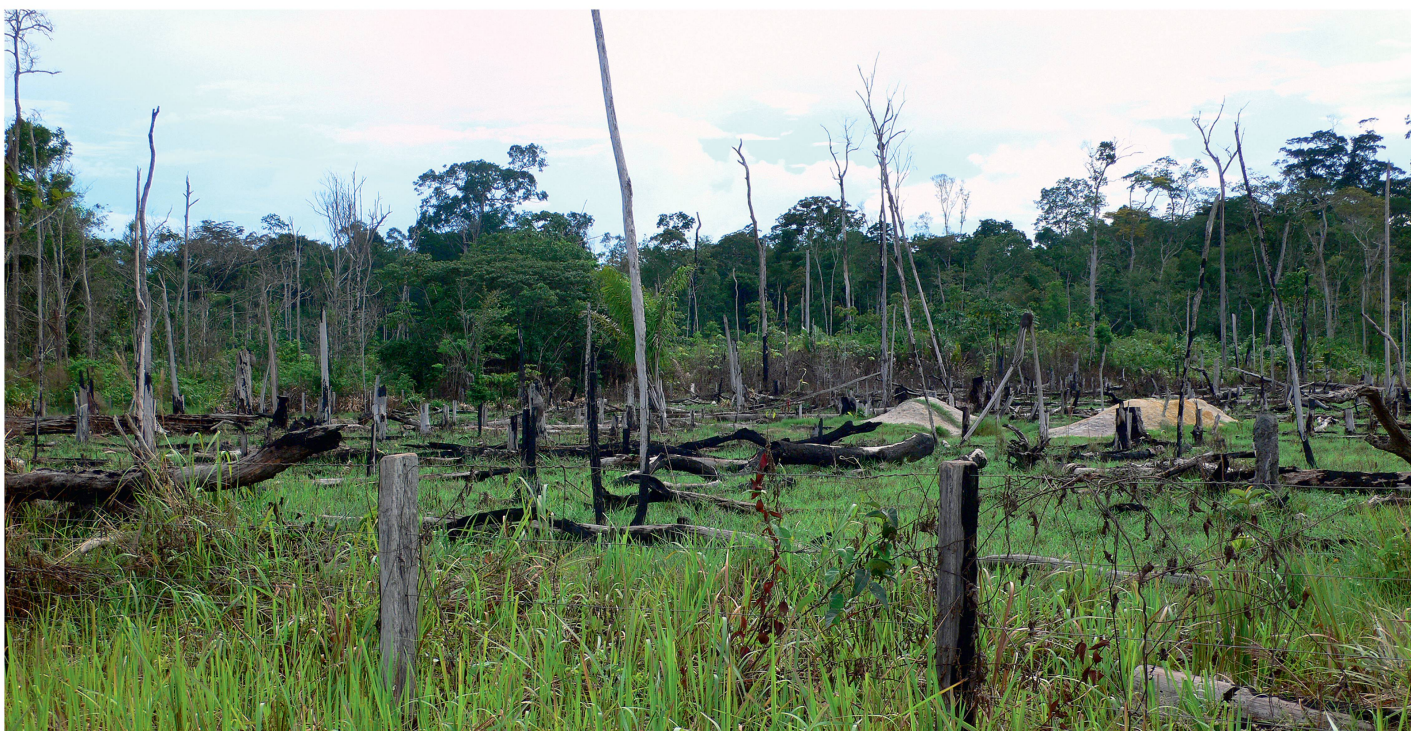
Abb 1 Brandrodung von Tropenwald.

heute im Grundsatz der Walderhaltung, zumindest in Mitteleuropa.