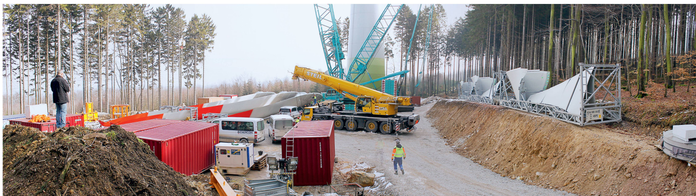
Studienreise nach Rheinland-Pfalz: Baustelle einer Windenergieanlage im Wald mit den liegenden Rotorblättern.

Die Abgeltungsvereinbarungen zwischen den Energieversorgern und den Grundbesitzern werden mit Pachtver-