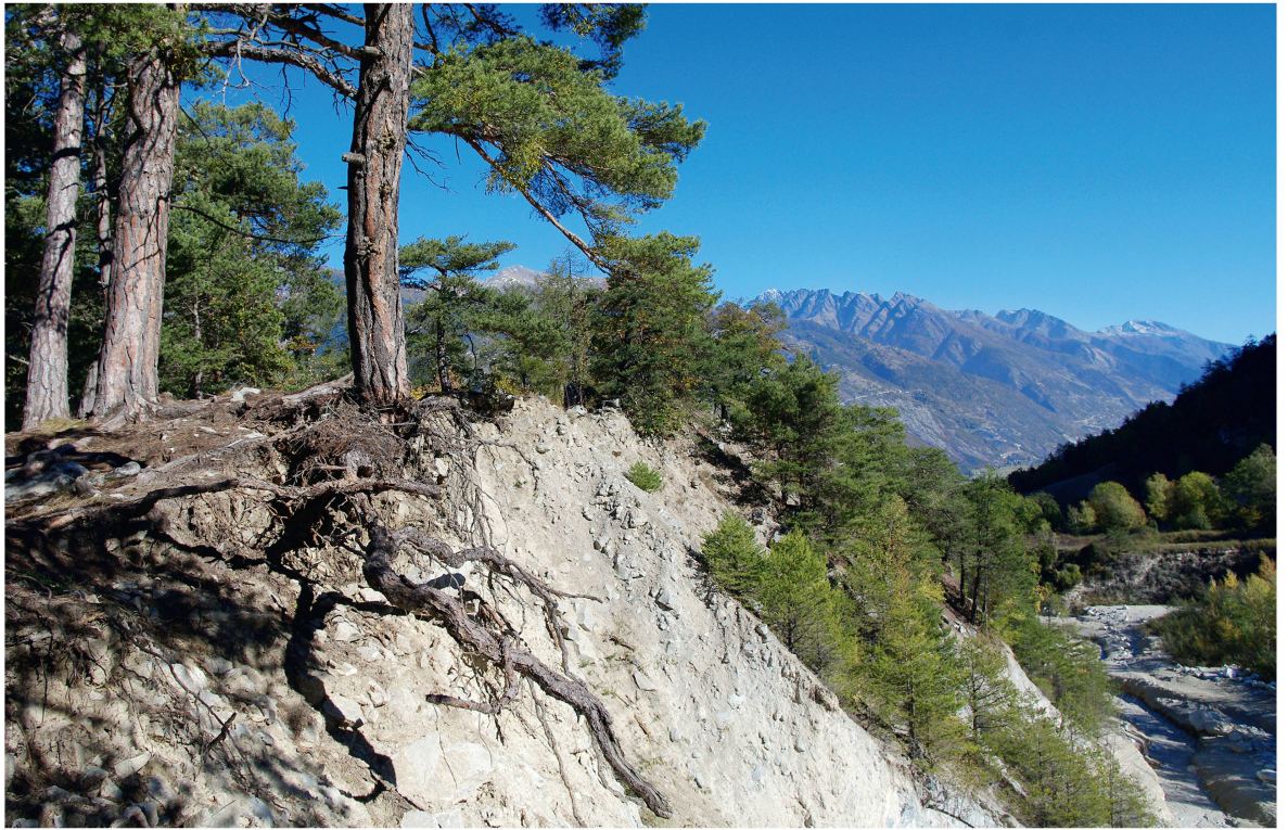
Abb 3 Im August 2012 sprach das Bafu dem Regionalen Naturpark Pfyn-Fingos im Wallis und drei weiteren Pärken das nationale Park-Label zu.

von zu grossen Bauzonen (Rückzonungen) sowie die Pflicht zur Überbauung von eingezonten Grundstücken (BK 2012b). Mit der Annahme des revidierten Raumplanungsgesetzes steht somit dem definitiven Rückzug der eidgenössischen Volksinitiative «Raum für Mensch und Natur» (Landschaftsinitiative; BBl 2012 5925) nichts mehr im Wege.