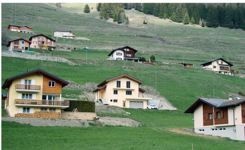
Abb 4 Mit der Annahme der Zweitwohnungsinitiative und dem Ja zur Revision des Raumplanungsgesetzes fordert das Schweizer Volk einen häuslicheren Umgang mit dem Boden als bisher.

ist das im letzten Jahresrückblick vorgestellte Europäische Waldabkommen, von dem immer noch kein definitiver Text vorliegt.