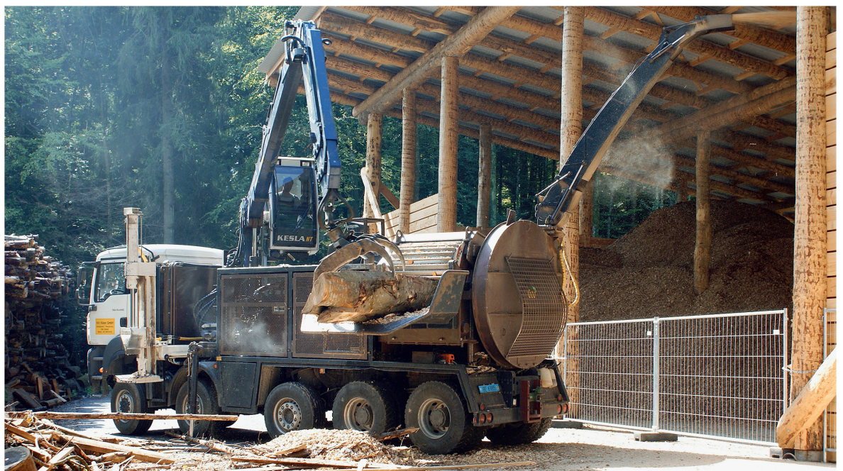
Abb 2 Im Rahmen der Revision der Waldverordnung sollen auch die raumplanerischen Rahmenbedingungen für die Lagerung von Energieholz gelockert werden.