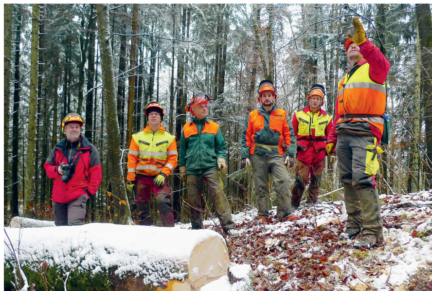
Abb 2 Instruktion anlässlich eines Holzerkurses für angehende Forstwirte.