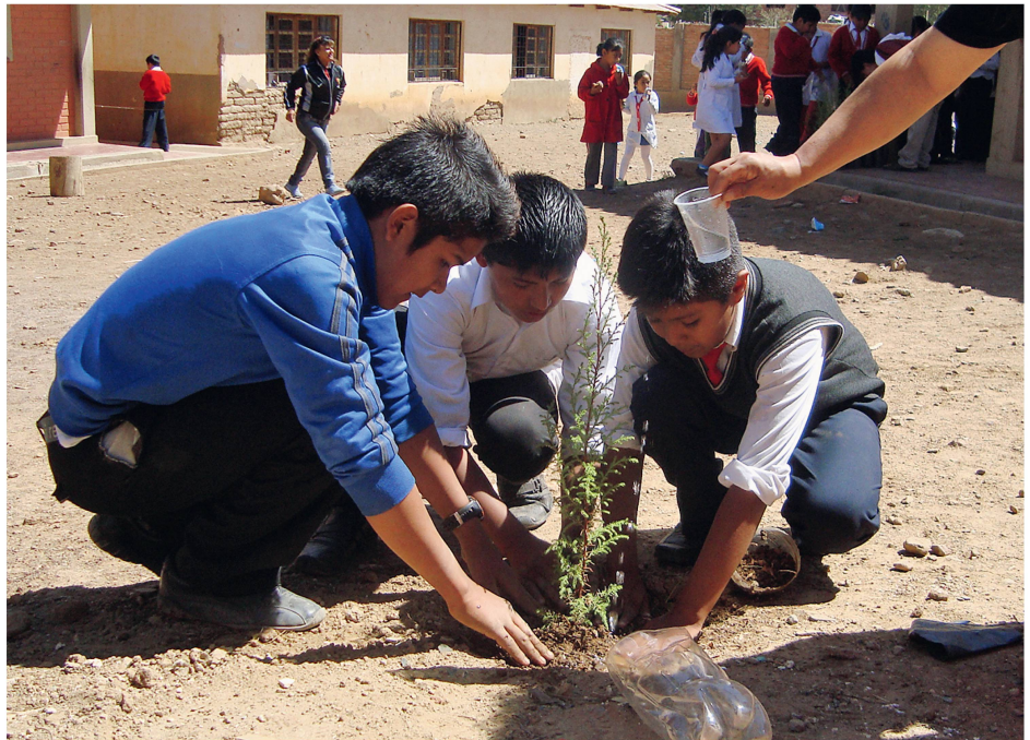
Abb 1 Kinder pflanzen einen Baum auf einem Schulhof in Cochabamba.

Cochabamba, eine stark wachsende Stadt mit rund einer Million Einwohnern im Zentrum Boliviens, sieht sich immer stärker mit Umweltproblemen konfrontiert: Luftverschmutzung durch zunehmenden Verkehr, grosse Mengen an Abfall und gleichzeitig Engpässe und fehlende Infrastrukturen in der Abfallbewirtschaftung sowie in der Versorgung der Haushalte mit Wasser. Arboles y Futuro, ein gemeinnütziger Verein mit Wurzeln in der Schweiz, unterstützt seit 2006 Aufforstungs- und Umweltbildungsprojekte im Departement Cochabamba. 1