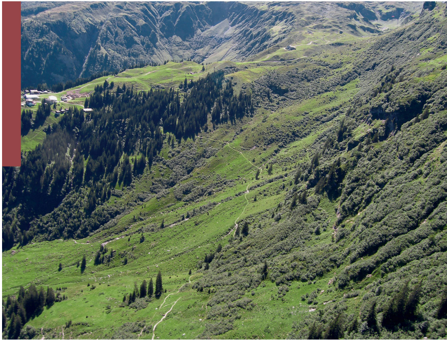
Abb 1 Grünerlenbestände auf der Alp Mugg beim Eingang zum Weisstannental (SG).

heimische, invasive Art, welche sich in optimalen Lagen rasch ausbreitet (Anthelme et al 2007). Dies zeigt sich derzeit im Alpenraum, insbesondere im Bereich der Waldgrenze nach der Aufgabe von Sömerungsbetrieben. Die Grünerle weist eine effiziente Ausbreitungsstrategie auf: Die Neubesiedlung erfolgt mit einer grossen Anzahl leichter, flugfähiger Samen, die Regenerierung des eigenen Bestandes mit Ablegern. Sie besitzt Wurzelknöllchen, die mithilfe von aktinomyzotischen Bakterien ( Frankia alni ) Luftstickstoff fixieren und den Boden damit anreichern (Delarze & Gonseth 2008). Dies fördert die Bildung von nährstoffliebenden Hochstaudenfluren im Unterwuchs, welche zusätzlich zu den Grünerlen das Aufkommen von Hochwald erschweren oder gar verunmöglichen. Durch Nitratauswaschung kann zudem die Trinkwasserqualität beeinträchtigt werden (Bühlmann 2011).