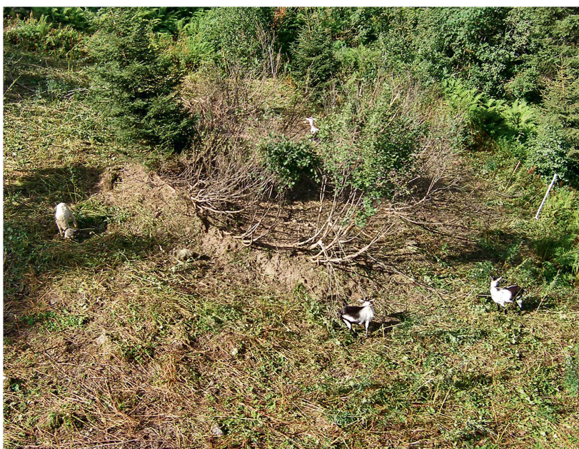
Abb 4 Beweidung mit Ziegen zur Bekämpfung der Grünerle. Bei Furt, oberhalb Wangs-Vilters (SG).

weitgehend, mindestens auf jenen Flächen, wo sie schon lange vorkommt. Für die in den letzten Jahrzehnten neu eingewachsenen Grünerlenflächen (z.T. in suboptimalen Lagen) kann mit dieser Untersuchung noch nicht beurteilt werden, wie stark der Hochwald einwachsen wird. Gleichzeitig fehlen jedoch in diesen Gebieten je länger, je mehr die Samenbäume des Hochwaldes.