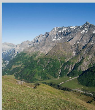
Blick auf einen Grünerlengürtel im Calfaisental (SG).

Inserate • Annonces • Advertisements Stämpfli Publikationen AG, Inseratemanagement, Wölflistrasse 1, Postfach 8326, CH-3001 Bern Telefon +41 31 300 63 89, Fax 63 90, inserate@staempfli.com 1120 Exemplare (durchschnittlich verkaufte bzw. abonnierte Auflage, notariell beglaubigt). Anzeigenschluss: jeweils am 15. des Vormonates oder nach Vereinbarung. Erscheinungsdatum: jeweils am 3. des Monats.