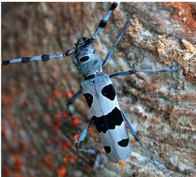
Abb 4 Der Alpenbock Rosalia alpina konnte durch Artenschutzmassnahmen gefördert werden.

(13018 ha) 97 Reservate (9000 ha) von Pro Natura oder der ETH gesichert, was 69% der Fläche der damals existierenden Waldreservate entsprach (Indermühle et al 1998). Der Schweizerische Nationalpark wurde dabei als privatrechtlich gesichert gezählt, obwohl seine vertragliche Sicherung 1958/1959 an die Schweizerische Eidgenossenschaft übergang.