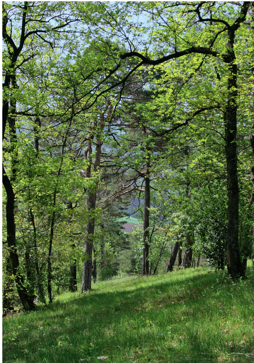
Abb 2 Beispiel eines Waldreservates mit Zielsetzung Seltenheit und Gefährdung: aufgelichteter Pfeifengras-Föhrenwald im Naturschutzgebiet Chilpen (Kanton Basel-Landschaft).

Alt- und Totholzinseln braucht es, damit durch das Zulassen der natürlichen Entwicklung Waldzustände entstehen, welche im Wirtschaftswald nicht oder zu selten vorkommen können (Abbildung 1). An diese Entwicklungsphasen sind Tier-, Pflanzen- und Pilzarten gebunden, welche sonst verschwinden.