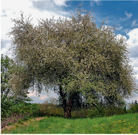
Ein Wildapfel in voller Blüte.

Die in Deutschland ansässige Dr.-Silvius-Wodarz-Stiftung hat den Wildapfel ( Malus sylvestris ) zum Baum des Jahres 2013 ernannt. Der bis etwa 10 m hoch werdende Wildapfel ist eine rein europäische Baumart, die zerstreut und zumeist einzeln in weiten Teilen des Kontinents verbreitet ist. Seine Lebensspanne ist mit 80 bis 100 Jahren relativ kurz. Der Wildapfel ist extrem Licht liebend, langsamwüchsig und konkurrenzschwach. Dementsprechend ist er sehr selten und gefährdet. ■