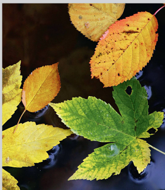
Herbstlaub auf Wasser.

Inserate • Annonces • Advertisements Stämpfli Publikationen AG, Inseratemanagement, Wölflistrasse 1, Postfach 8326, CH-3001 Bern Telefon +41 31 300 63 89, Fax 63 90, inserate@staempfli.com 1120 Exemplare (durchschnittlich verkaufte bzw. abonnierte Auflage, notariell beglaubigt). Anzeigenschluss: jeweils am 15. des Vormonates oder nach Vereinbarung. Erscheinungsdatum: jeweils am 3. des Monats. Weitere Einzelheiten siehe www.forstverein.ch .