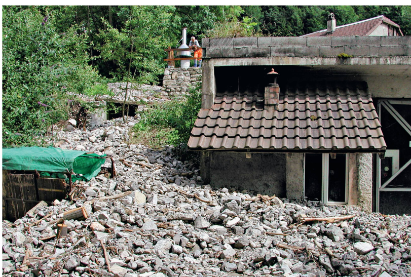
Fig. 2 La forêt joue un rôle important pour limiter les dangers naturels gravitationnels, mais l'implantation de constructions dans les zones à risque ne relève pas de la planification forestière.

Confrontés à ces résistances, il a fallu mieux définir les processus d'élaboration des plans directeurs forestiers. D'un travail essentiellement réalisé par un inspecteur forestier d'arrondissement, assisté par des bureaux spécialisés, on est passé à un processus participatif où la concertation avec les parties est organisée. On constate donc que le processus d'élaboration des plans directeurs forestiers est pertinent en fonction des objectifs définissant une gestion durable et multifonctionnelle et qu'il permet de faire participer des acteurs très différents autour d'un même projet. Il contribue de manière significative à