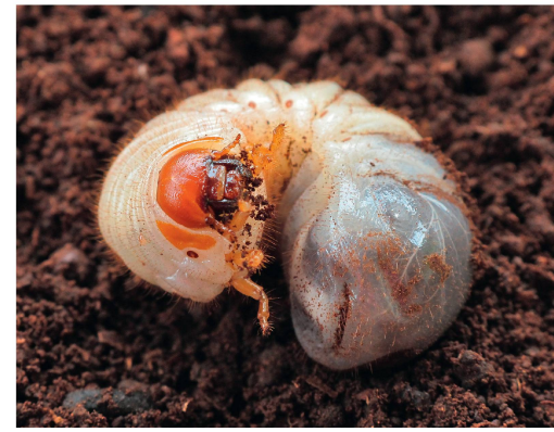
Fig. 3 Larve âgée d' Osmoderma eremita .

rés qu'occasionnellement par des fruits fermentés (Prunier 2009).