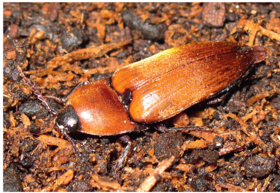
Fig. 6 Adulte d' Elater ferrugineus .