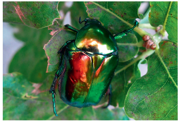
Fig. 7 Adulte de Protætia aeruginosa .

s'effectue à l'intérieur des cavités, comme cela était supposé. Les œufs sont pondus un à un dans une alvéole aménagée par la femelle dans le terreau de la cavité choisie et après trois semaines d'incubation, les premières éclosions ont lieu (Lequet 2010).