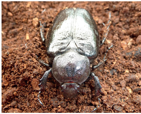
Fig. 2 Osmoderma eremita femelle.