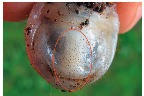
Fig. 5 Absence de raster sur une larve d' Osmoderma eremita .