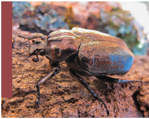
Fig. 1 Osmoderma eremita mâle.