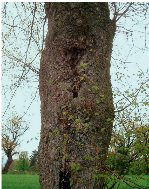
Fig. 8 Cavités inaccessibles par des moyens de prospection habituels.

lorsque la cavité à sonder est en hauteur et fait déjà appel à un équipement d'ascension encombrant, mais s'avèrent être souvent les plus efficaces pour la détection des résidus d'osmoderme.