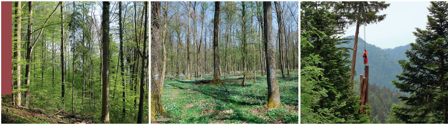
Abb 1 Vielfältige Zürcher Wälder. Links: Buchen-Laubmischwald am Zürichsee, Mitte: Unterländer Eichenmischwald, rechts: Buchen-Tannen-Wald im Zürcher Oberland.