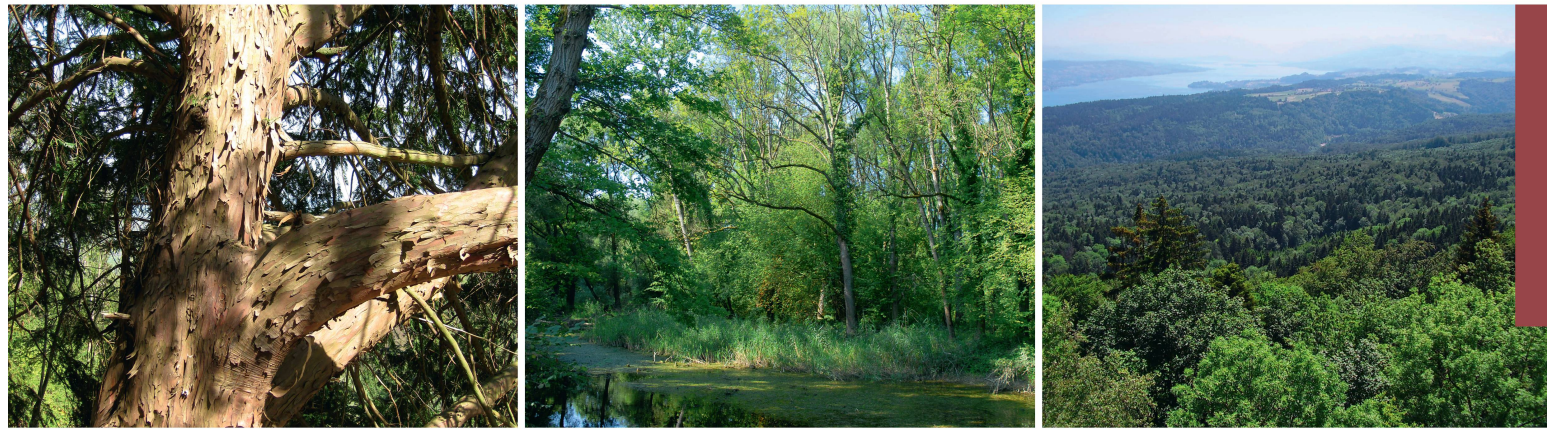
Abb 3 Spezielle Naturwerte im Zürcher Wald. Links: europaweit bedeutendes Eibenvorkommen im Raum Zürich, Mitte: Thurauen, Sihlwald als grösstes Naturwaldreservat im Schweizer Mittelland.

tur, pflegen den fachlichen Austausch, sind aber ansonsten ausschliesslich für ihren Kreis zuständig. Die aktuelle Grösse der Reviere und Kreise ermöglicht dem Forstdienst aller Stufen, seine Aufgaben regional angepasst, ortskundig und nahe bei Waldeigentümern und Bevölkerung zu erfüllen. Er ist damit in der Lage, unmittelbar auf der Fläche zu arbeiten, und erreicht einen guten Wirkungsgrad und eine hohe Akzeptanz. Förster und Kreisforstmeister stehen in ständigem Kontakt, sei es an den regelmässigen Kreisrapporten, sei es im Rahmen der Nutzungsplanung und der Beratungsgespräche im Wald. Das hat zahlreiche Vorteile: Der Förster hat bei seinen gesetzlichen Aufgaben einen guten Rückhalt, und ein einheitlicher Vollzug ist gewährleistet. Der Kreisforstmeister ist über die Waldbewirtschaftung im Kreis und die Forstbetriebe auf dem Laufenden, was Aufgaben wie Beratung, Gesetzesvollzug und Information wesentlich erleichtert.