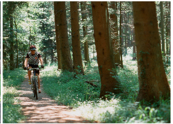
Abb 4 Nutzungsüberlagerungen, im Bild Holzproduktion und Freizeitvergnügen.

Basis für den fachlichen und persönlichen Austausch zwischen Waldeigentümer und Forstdienst. Der Forstdienst aller Stufen ist auch bei grösseren Waldeigentümern stets auf dem aktuellsten Stand der Ausführung und kann auf externe Anfragen oder etwaige Schadereignisse adäquat reagieren. In Bezug auf die Nachhaltigkeitskontrolle sei angemerkt, dass diese bereits mit der gemeinsamen, einvernehmlichen Erarbeitung der Jahresprogramme beginnt!