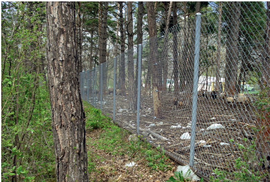
Abb 4 Das Bundesgericht bestätigt ein Kantonsgerichtsurteil, welches die Servitutsbewilligung für einen Tierpark im Waldareal eines BLN-Gebietes verweigerte.

Nutzung, Waldeinzäunung und Waldabstand) und das Bundesgesetz vom 22. Juni 1979 über die Raumplanung (Raumplanungsgesetz, RPG, SR 700; Trennung des Baugebietes vom Nichtbaugebiet) verstosse.