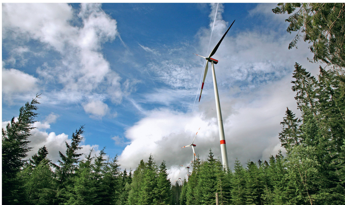
Abb 3 Mit der Motion «Bau von Windenergieanlagen in Wäldern und an Waldrändern» soll eine Lockerung der Rodungsvoraussetzungen für den Bau von Windenergieanlagen im Wald erreicht werden.

nienwälder über die Förderung von Holz- und Windenergieanlagen beziehungsweise der Holzindustrie bis zur Errichtung eines Waldklimafonds. Im Folgenden sollen die drei zum Wald eingereichten Motionen kurz vorgestellt werden.