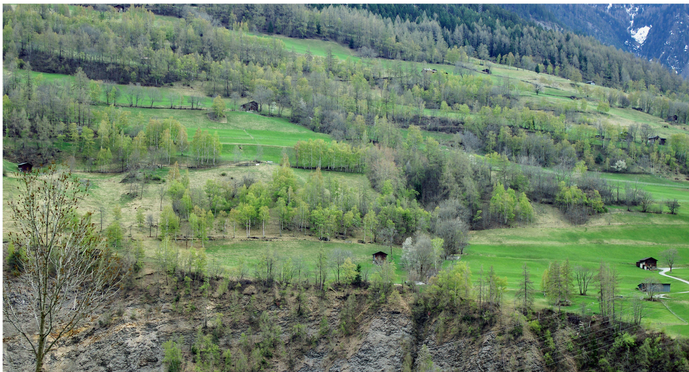
Abb 1 In Gebieten mit zunehmender Waldfläche können bei Rodungen künftig anstelle von Realersatz gleichwertige Massnahmen zugunsten des Natur- und Landschaftsschutzes getroffen werden.

sätzlichen und zwei kleinen Vorbehalten zu Wort. Das grundsätzliche Votum stammte vom Genfer Ständerat Robert Cramer, der in der Revisionsvorlage eine grobe Verletzung des Demokratieprinzips sah. Vor allem mit der generellen Einführung des statischen Waldbegriffes würde man ein Versprechen brechen, mit welchem das Parlament seinerzeit die Initianten der Volksinitiative «Rettet den Schweizer Wald» zum Rückzug der Initiative bewogen hätte. Er wurde unterstützt von Erika Forster-Vannini (SG) und Hans Hess (OW), welche forderten, dass die beiden Kernpunkte der Vorlage, nämlich die Lockerung der Ersatzaufforstungspflicht und die Möglichkeit der Ausdehnung des statischen Waldbegriffes auf ausserhalb der Bauzonen, restriktiver gefasst werden, als dies die Kommissionsmehrheit vorgeschlagen hatte.