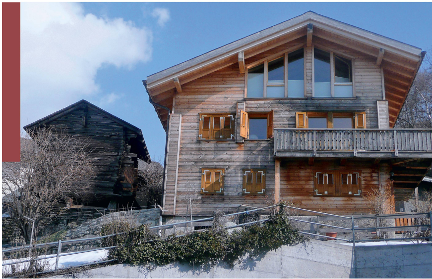
Abb 5 Gemäss dem neuen CO 2 -Gesetz ist die Leistung der Senken von verbautelem Holz zur Reduktion der Treibhausgasemissionen anrechenbar.

tionsziel bei den Treibhausgasemissionen von 20% (Art. 3). Die Debatte im Parlament drehte sich vor allem um die Frage, ob die zur Erreichung dieses Reduktionszieles erforderlichen Massnahmen vollumfänglich im Inland oder teilweise (z.B. maximal die Hälfte) auch im Ausland getroffen werden können. Das Parlament hat sich grundsätzlich für die strengere Inlandlösung entschieden, gab aber vor allem den Industrieunternehmen die Möglichkeit, sich mit der Beteiligung am European Union Emission Trading System (EU ETS) auch mit Auslandmassnahmen CO 2 -Reduktionen gutschreiben zu lassen (Art. 5 ff.).