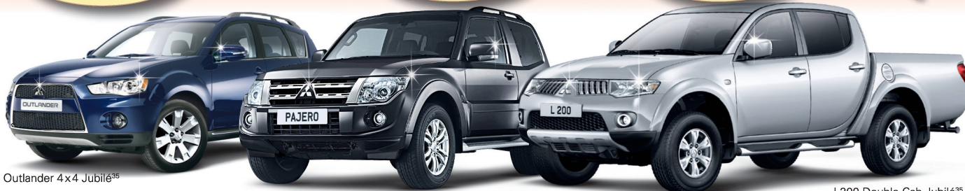
Outlander 4x4 Jubilé 35