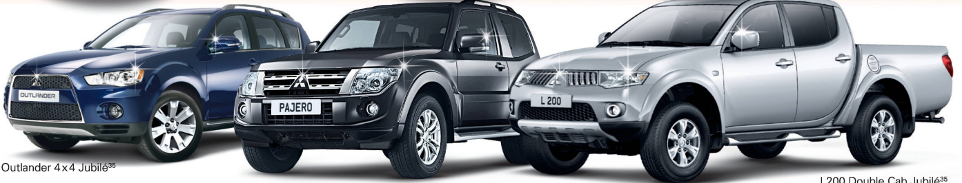
Outlander 4x4 Jubilé 35