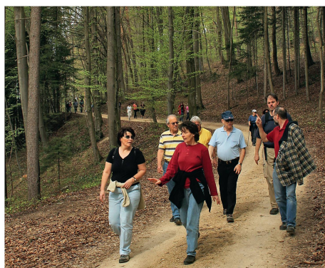
Die Schweizer Bevölkerung hält sich gerne und viel im Wald auf.

Die Bevölkerung der Schweiz hat ein breites Verständnis der vielfältigen Waldleistungen und weiss diese zu schätzen. Dies zeigen die Mitte Februar 2012 veröffentlichten Resultate der repräsentativen Bevölkerungsumfrage «Waldmonitoring soziokulturell», welche im Folgenden auszugsweise wiedergegeben werden.