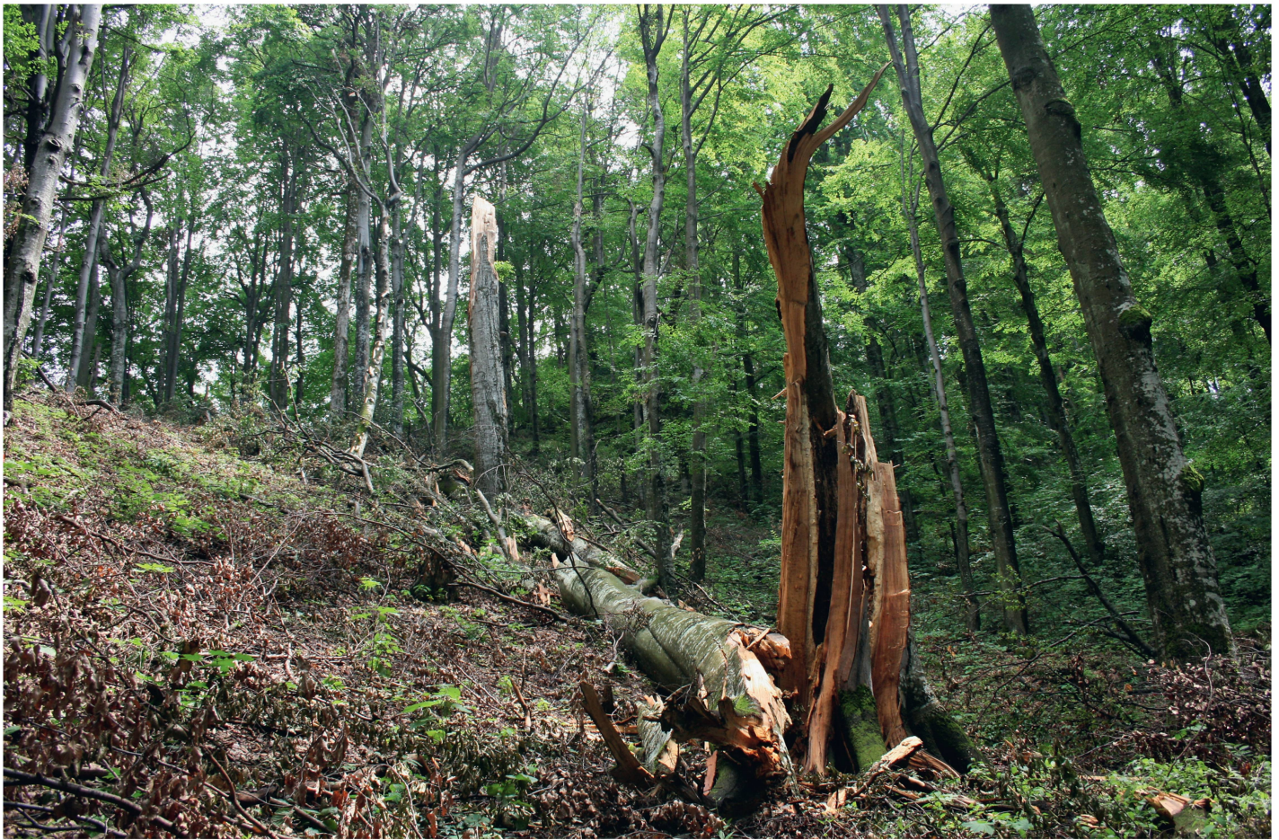
Abb 1 In Altholzinseln kann sich eine natürliche Dynamik des Zerfalls einstellen.

Lebensräume für verschiedenste Organismen sind. So kann sich zumindest kleinräumig eine natürliche Dynamik des Zerfalls einstellen (Abbildung 1).