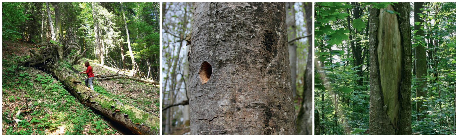
Abb 2 Totholz, Spechtbäume und Habitatstrukturen (hier eine Rindenverletzung) wurden zur Modellierung der Minimalfläche von Altholzinseln verwendet.

Wälder in der Zerfallsphase weisen meistens eine heterogene Struktur auf. Durch einen absterbenden oder umstürzenden Baum entsteht kleinräumig eine Anhäufung von Totholz, lichtreichen Habitaten und zusätzlichen Habitatstrukturen, während auf direkt angrenzenden Flächen diese Strukturen nahezu fehlen können. Unser Ziel war es, diejenige Flächengröße zu bestimmen, bei der eine Altholz-