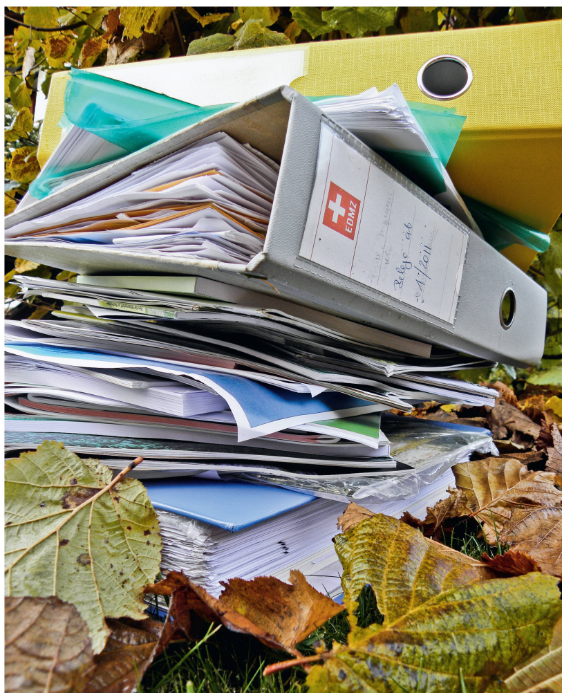
Abb 4 Die Kosten zur Lösung von Nutzungskonflikten mittels politisch-bürokratischer Koordination entstehen aus dem tendenziellen Anwachsen der Bürokratie.