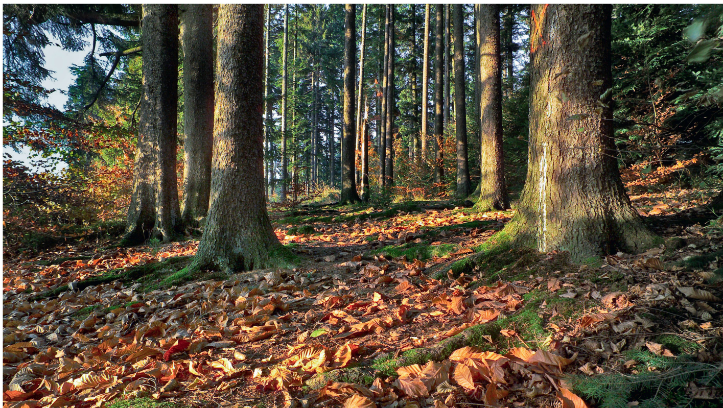
Abb 2 Im Grunde genommen werden die Kosten der Waldbetreuung (und andere nicht an das Waldeigentum gebundene Nutzungsrechte) von den Waldeigentümern getragen, indem sie in erheblichem Umfang auf die Rentabilität der Holzproduktion verzichten.

Mithilfe dieses schematischen Beispiels gelingt es, wesentliche Elemente eines Nutzungskonflikts herauszuarbeiten. Dadurch wird nicht nur dieser eine exemplarische Nutzungskonflikt untersucht. Vielmehr kann das Beispiel als Schema zur Analyse beinahe jedes im Zusammenhang mit Verfügungsrechten auftretenden Nutzungskonflikts dienen (Homann & Suchanek 2000).