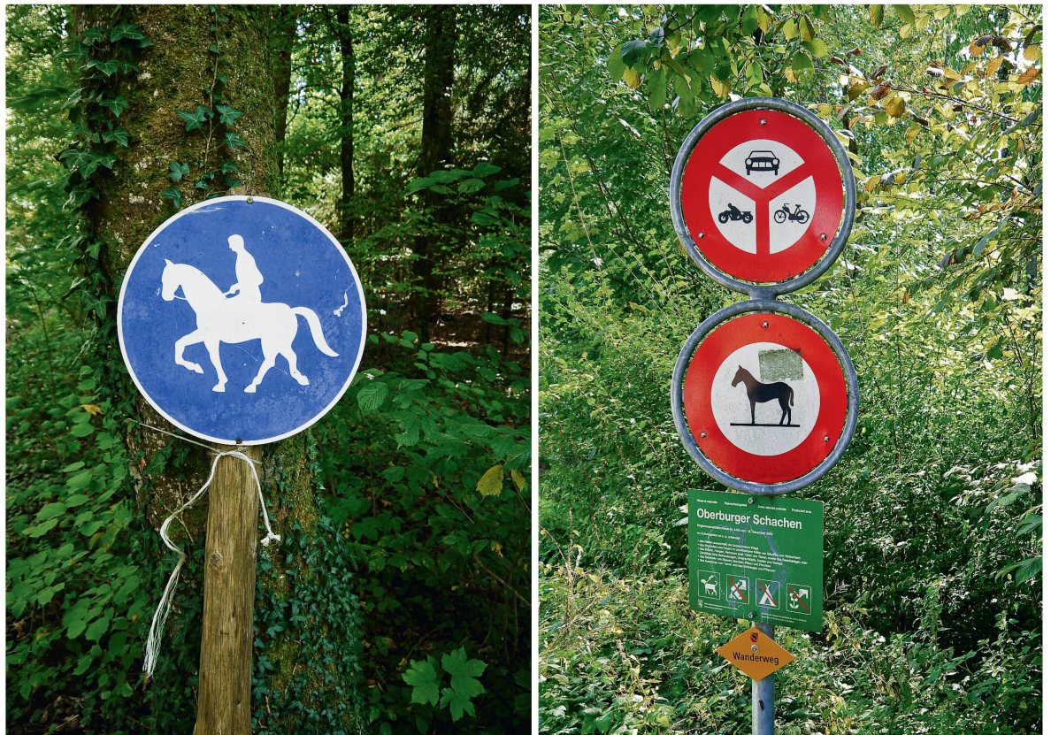
Abb 3 Bedenkt man die Heterogenität der Waldbetreter und berücksichtigt man andere Gruppen von Waldnutzern, ist die Allokation der Waldbetretung durch eine hohe Komplexität und Dynamik gekennzeichnet.

Erweitert man den Waldbetreter-Waldeigentümer-Fall um weitere Waldnutzer, sind ein erhebliches Ansteigen der Komplexität bei der Allokation der Waldbetretung und eine Vervielfachung der einzelnen Lösungen beinahe unausweichlich. Eine erste Erweiterung kann durch Gliederung der Waldbetreter in verschiedene Teilgruppen wie Spaziergänger, Jogger, Biker, Naturbeobachter, Reiter und andere mehr erfolgen (Abbildung 3). Untersuchungen, zum Beispiel im Allschwiler Wald, zeigen nämlich, dass sich Waldbesucher gegenseitig deutlich stören kön-