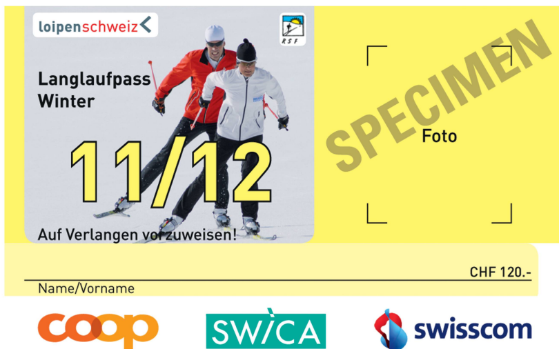
Abb 5 Der Langlaufpass – ein auf der Privatrechtsordnung basierendes Beispiel.

Dagegen können reine Nutzen-Kosten-Vergleiche von gesellschaftlichen Arrangements, die losgelöst von den Regeln gerechten Verhaltens erfolgen,