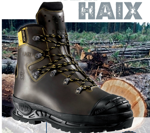
HAIX® FG System