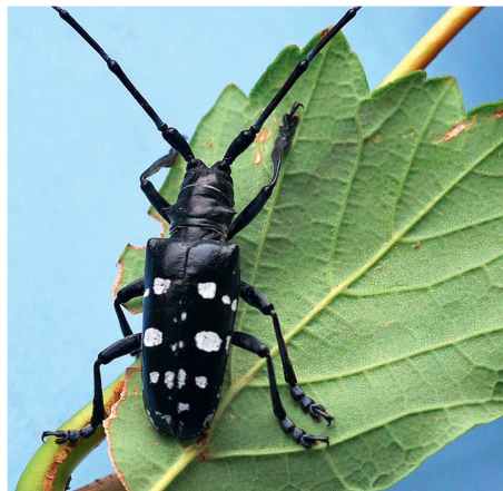
Der Bund erarbeitet ein Konzept für den Umgang mit biotischen Gefahren. Der eingeschleppte Asiatische Laubholzbockkäfer ( Anoplophora glabripennis ), der kürzlich erstmals in der Schweiz nachgewiesen wurde, zerstört Laubhölzer und gilt als besonders gefährlicher Schädling.

KoK-Ausschusses in einem Workshop die Frage nach der Weiterentwicklung der Qualitätsprofile für die Waldberufe analysiert. Dies erfolgte in erster Linie aus Sicht der Nachfrager. Im Workshop dabei waren je ein Vertreter eines grossen Forstbetriebes, einer Forstunternehmung, eines Forstingenieurbüros und einer Waldwirtschaftsorganisation. Die Resultate werden zwecks Aktualisierung des Dossiers «Qualitätsanforderungen an die Waldberufe» dem Plenum der KoK vorgelegt.