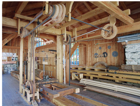
Alte Säge von Turtmann im Wallis.

Die Holzbearbeitung ist so alt wie die Menschheit, da Holz schon immer ein verfügbarer und relativ leicht zu bearbeitender Werkstoff war. Wer an historischen Sägen interessiert ist und einen Besuch bei der einen oder anderen plant, findet auf dem Webportal www.historische-saegen.ch nützliche Informationen. ■