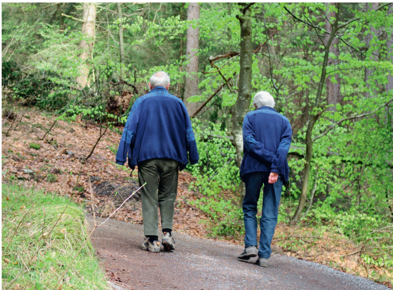
Abb 2 Nach heutigem Verständnis umfasst die nachhaltige Waldbewirtschaftung auch soziale und ökologische Aspekte.

haltigen Waldbewirtschaftung auf, 2 und das Konzept der Ökosystemleistungen unterscheidet unterstützende, bereitgestellte, regulierende und kulturelle Leistungen für das Wohlbefinden von Menschen (Millennium Ecosystem Assessment 2005). Die Ausführungen in den entsprechenden Dokumenten lassen sich so verstehen, dass die verschiedenen Nachhaltigkeitsdimensionen nicht nach Wichtigkeit geordnet und weder aufeinander reduzierbar noch wechselseitig (beliebig) kompensierbar sind.