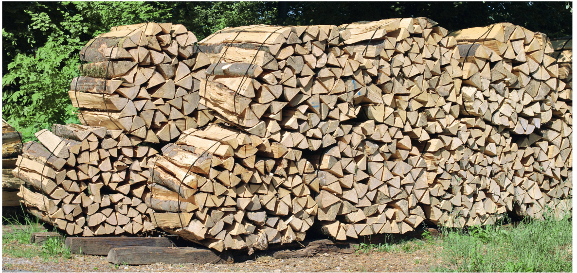
Abb 1 Am Anfang des Nachhaltigkeitsgedankens stand die Sicherstellung einer dauerhaften Holznutzung.

Abschliessend werden die Resultate zusammengefasst und in ihrer Bedeutung für die nachhaltige Waldbewirtschaftung diskutiert.