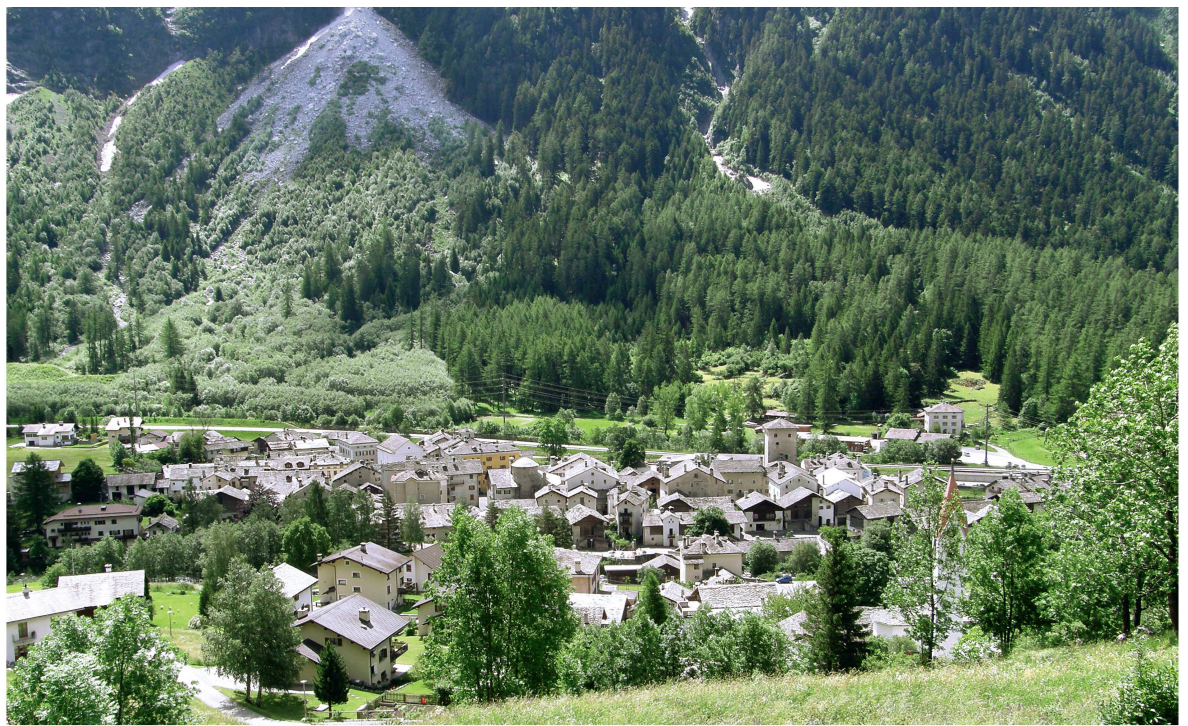
Abb 4 Vicosoprano ist eine der fünf früheren Gemeinden im Bergell. Heute gehört Vicosoprano zur Gemeinde Bregaglia.

Im Bergell präsentiert sich die Situation umgekehrt. Rund 52% der Waldgäste sind ferienhalber im Bergell. 48% können als Tagesgäste bezeichnet werden. Typischerweise reisen sie aus Italien oder ihrem Ferienort im Engadin an (weniger als 5% kommen vom Wohnort im Bergell). Für die Bergeller Wälder ermittelten wir einen Wert von rund 86 000 Besuchstagen und damit eine Besucherdichte von 17 Besuchstagen pro Jahr und Hektare.