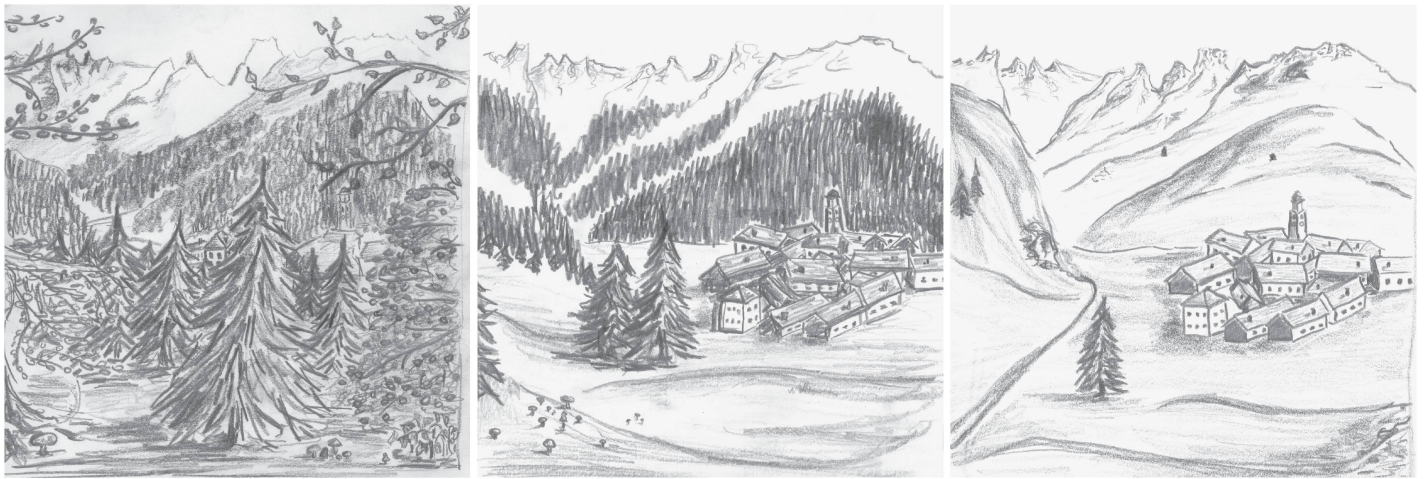
Abb 2 Landschaftsbilder der Conjoint-Analyse im Bergell. Zeichnungen: Irene Vogt

die relativen Wichtigkeiten der einzelnen Merkmale für die Beurteilung schliessen (zur mathematischen Modellierung siehe Backhaus et al 2003).