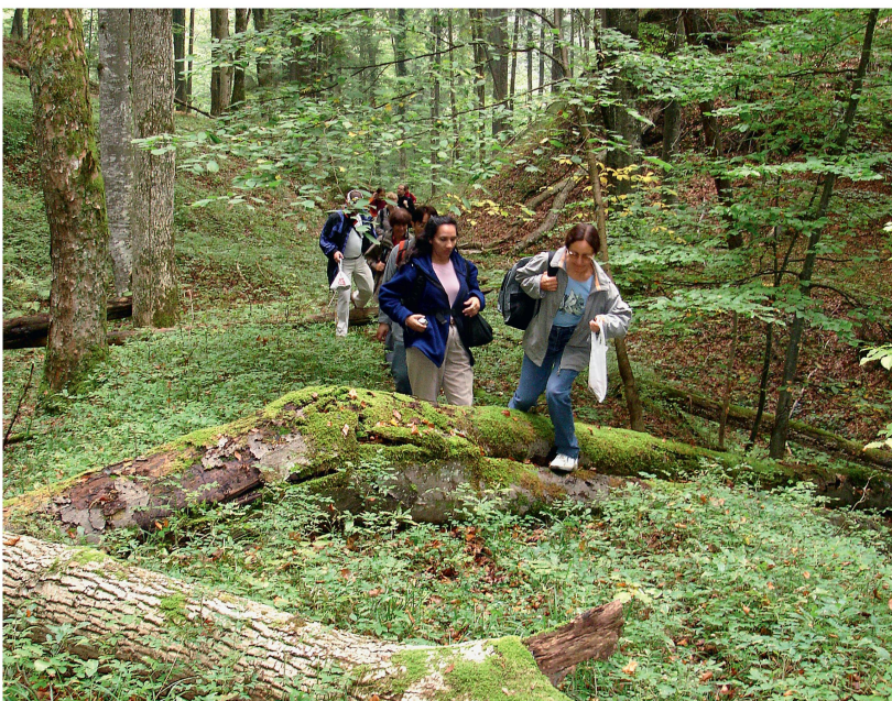
Abb 3 Mehr als die Hälfte der Gäste im Sihlwald können als «waldaffin» bezeichnet werden, das heisst, sie bevorzugen Landschaftsbilder mit viel Wald und messen der Landschaft bei der Destinationswahl einen sehr hohen Stellenwert bei.