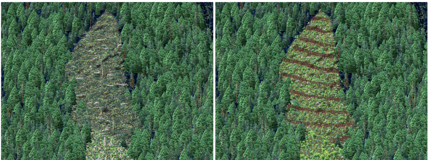
Abb 3 Nahaufnahme der Windwurffläche. Links: direkt nach dem Windwurf, rechts: Zustand nach etwa 10 bis 15 Jahren mit Stahlbrücken.

Visualisierungen gearbeitet. Neuere Studien haben gezeigt, dass die Anwendung von Visualisierungen bei Choice-Experimenten die Variabilität der Präferenzen und die Asymmetrie der Antworten zwischen der Frage nach der Zahlungsbereitschaft und einer entsprechenden Kompensationsforderung signifikant reduziert (Bateman et al 2009).