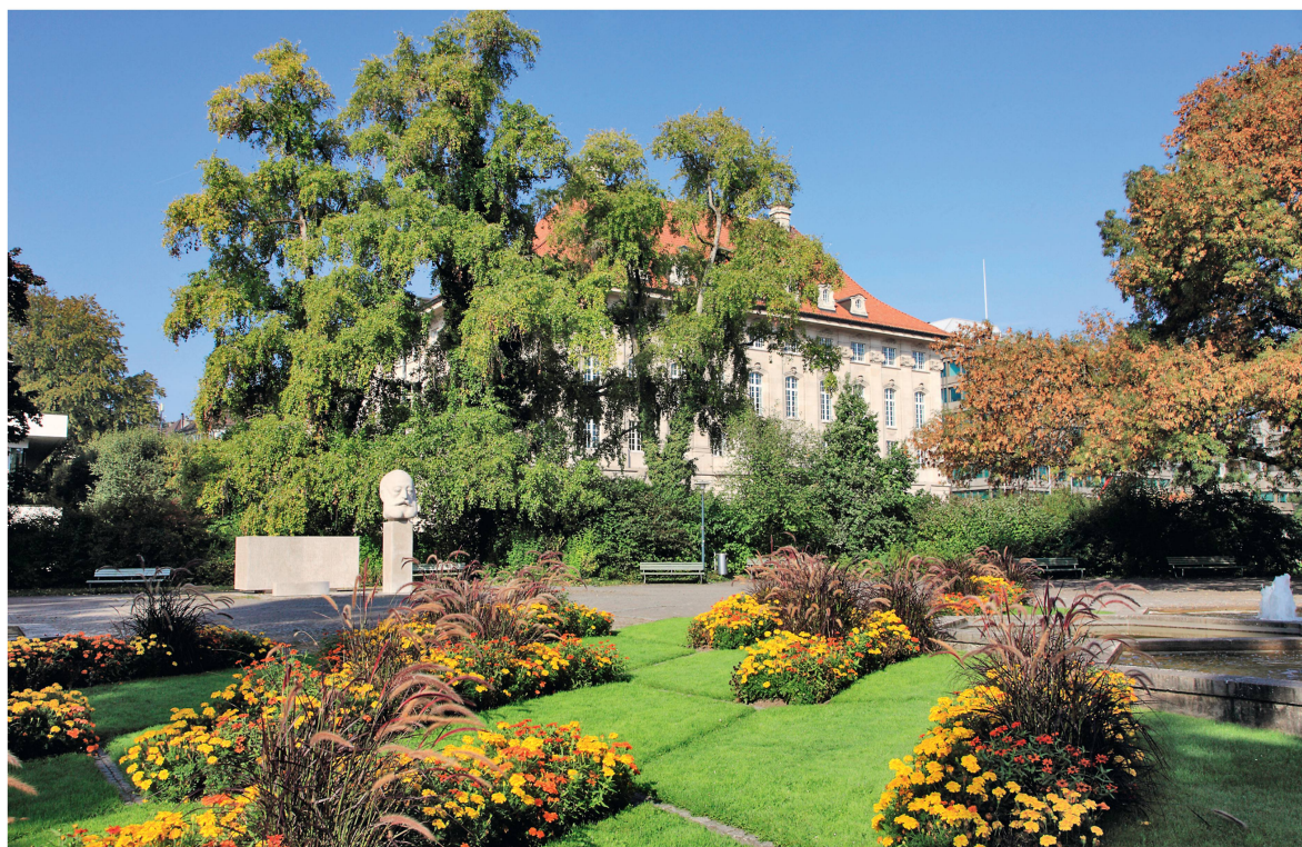
Abb 3 Als für Bäume wichtige Gebiete ausserhalb des Waldes stehen die Siedlungen hervor.

Eingereicht: 16. Dezember 2010, akzeptiert (mit Review): 26. April 2011