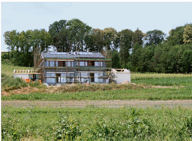
Fig. 3 La surface bâtie augmente au détriment des surfaces agricoles.

Au parlement, la pression sur la forêt s'est accentuée concrètement par le dépôt récent d'une initiative parlementaire (PI 09.747) demandant l'allègement des conditions de défrichage et la levée de l'obligation de compenser quantitativement les surfaces déboisées et d'une motion (10.3489) demandant l'introduction de la forêt dans la Loi sur l'aménagement du territoire afin de pouvoir compenser la perte des surfaces d'assolement. Cela pourrait se justifier dans les régions alpines, où les agriculteurs récupéreraient des surfaces recolonisées par la forêt, mais en plaine ce serait un désastre: si les surfaces forestières sont transformées en zones agricoles, elles