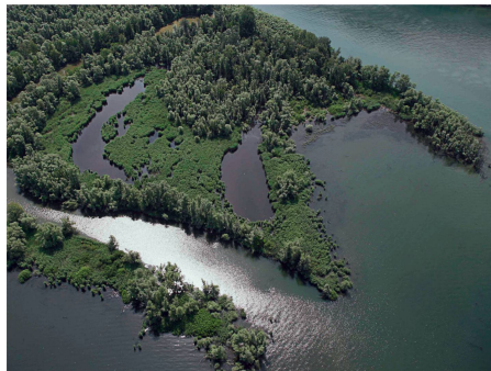
Die Bolle di Magadino wurde aufgewertet.