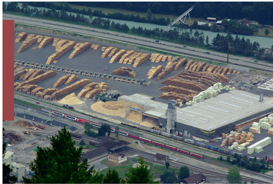
Abb 2 Die Rolle des Bundes bei der Finanzierung von staatlichen Rettungspaketen wurde anlässlich des Konkurses der Mayr-Melnhof Swiss Timber AG Ende 2010 heftig diskutiert.