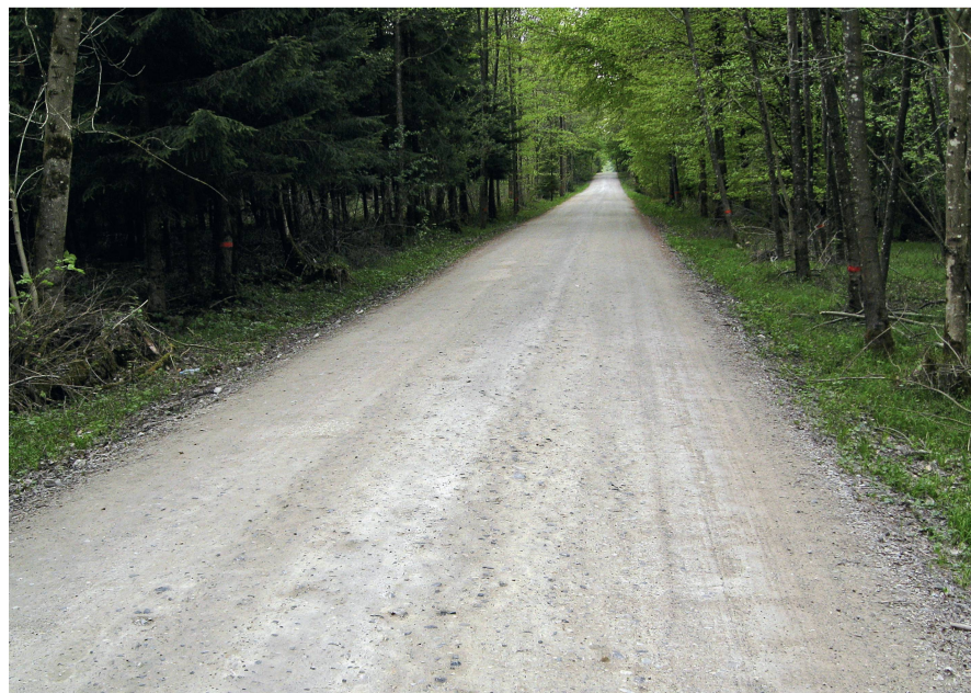
Abb 3 Für die Überführung einer Waldstrasse ins allgemeine Strassennetz ist laut Bundesgericht eine Rodungsbewilligung erforderlich.

Die Raumentwicklungspolitik wird zurzeit stark von der eidgenössischen Volksinitiative «Raum für Mensch und Natur», der sogenannten Landschaftsinitiative, geprägt. Diese hat zu einer eiligen Teilrevision des Bundesgesetzes vom 22. Juni 1979 über die Raumplanung (Raumplanungsgesetz, RPG, SR 700) geführt, welche der Ständerat als Erstrat im Herbst 2010 behandelt hat (AB 2010 S 880 und 904). Der Ständerat folgte im Wesentlichen den Vorschlägen des Bundesrates (BBl 2010 1049) und beschränkte sich schwerpunktmässig auf Neuregelungen im Bereich der Bauzonen und der Siedlungsentwicklung. Er ergänzte die vorwiegend auf die Richtplanung fokussierte Revision mit der Änderung von rund einem halben Dutzend weiterer Gesetzesartikel, die vorwiegend ebenfalls die Bauzonen zum Gegenstand haben. Die aus forstlicher Sicht wichtigste Änderung betrifft die Neuregelung der raumplanerischen Mehrwertabschöpfung im bisherigen Art. 5 RPG. Der neue Art. 5a sieht vor, die Kantone durch den Bund