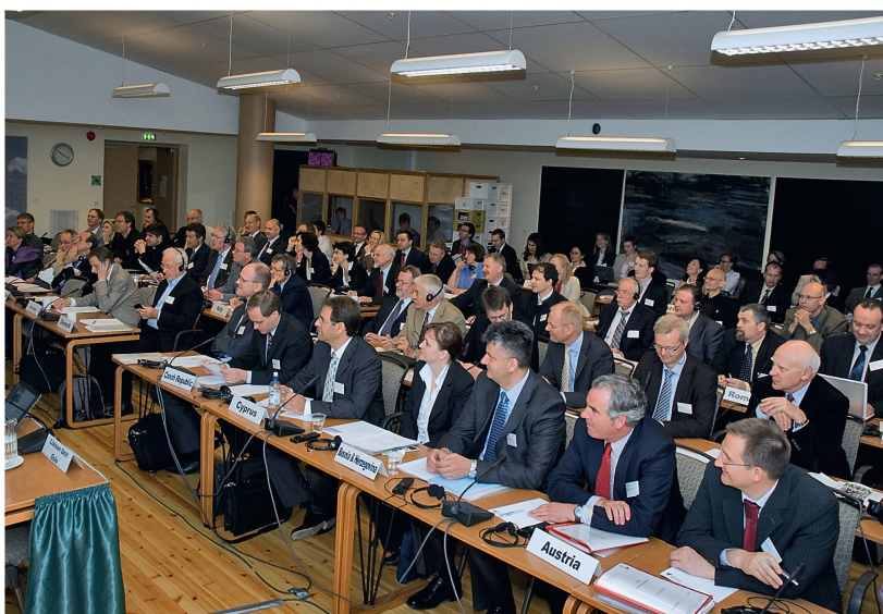
Abb 1 Verhandlungen bei Forest Europe zur Vorbereitung der Ministerkonferenz vom Juni 2011 in Oslo.

und die nationale Waldpolitik der Schweiz bedeuten. Das Bafu wertet die Ergebnisse der bisherigen Vorarbeiten positiv. Für die Schweiz steht eine verbindliche Konvention mit dem Ziel einer dauerhaften Stärkung der nachhaltigen Waldwirtschaft im Vordergrund. Dabei unterstützt die Schweiz insbesondere die Schaffung einer gesamteuropäischen Waldpolitik unter Mitwirkung der EU- sowie der Nicht-EU-Länder inklusive Russlands und der ost- und südosteuropäischen Staaten. So könnten mit der Schaffung einer gesamteuropäischen Vereinbarung zusätzliche Synergien zwischen den verschiedenen walddrelevanten Prozessen gefördert werden, mit dem mittelfristigen strategischen Ziel der Schaffung eines einzigen europäischen Waldprozesses, der auch die institutionellen Bedürfnisse der Welternährungsorganisation (FAO) und der Uno-Wirtschaftskommission für Europa (UNECE) abdecken soll.